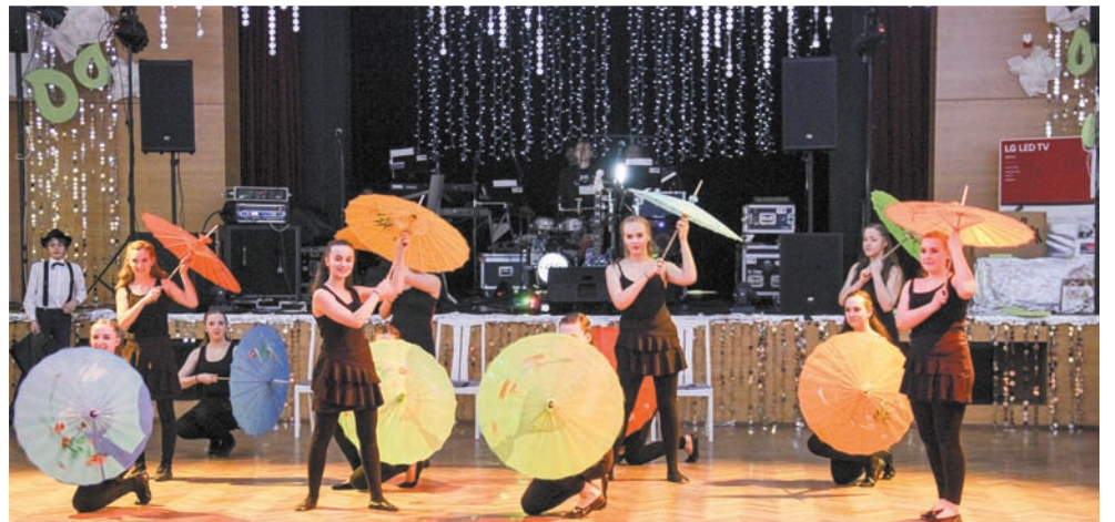
• Tym razem karwińskim balowiczom zaprezentowali się młodzi tancerze z Oldrzychowic.