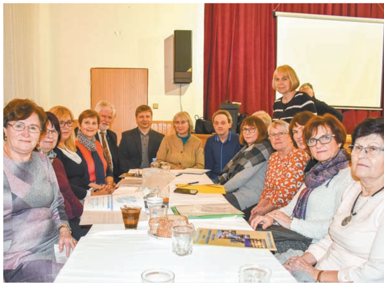
• Powiększony zarząd w pełnej gotowości do działania.