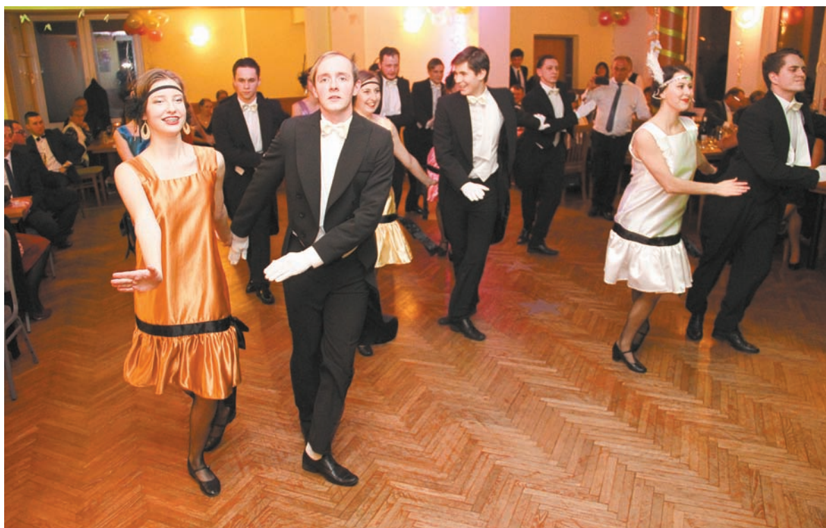
• Tancerze Zespołu Folklorystycznego „Bystrzyca” brawurowo wykonali w sobotę m.in. charlestona.