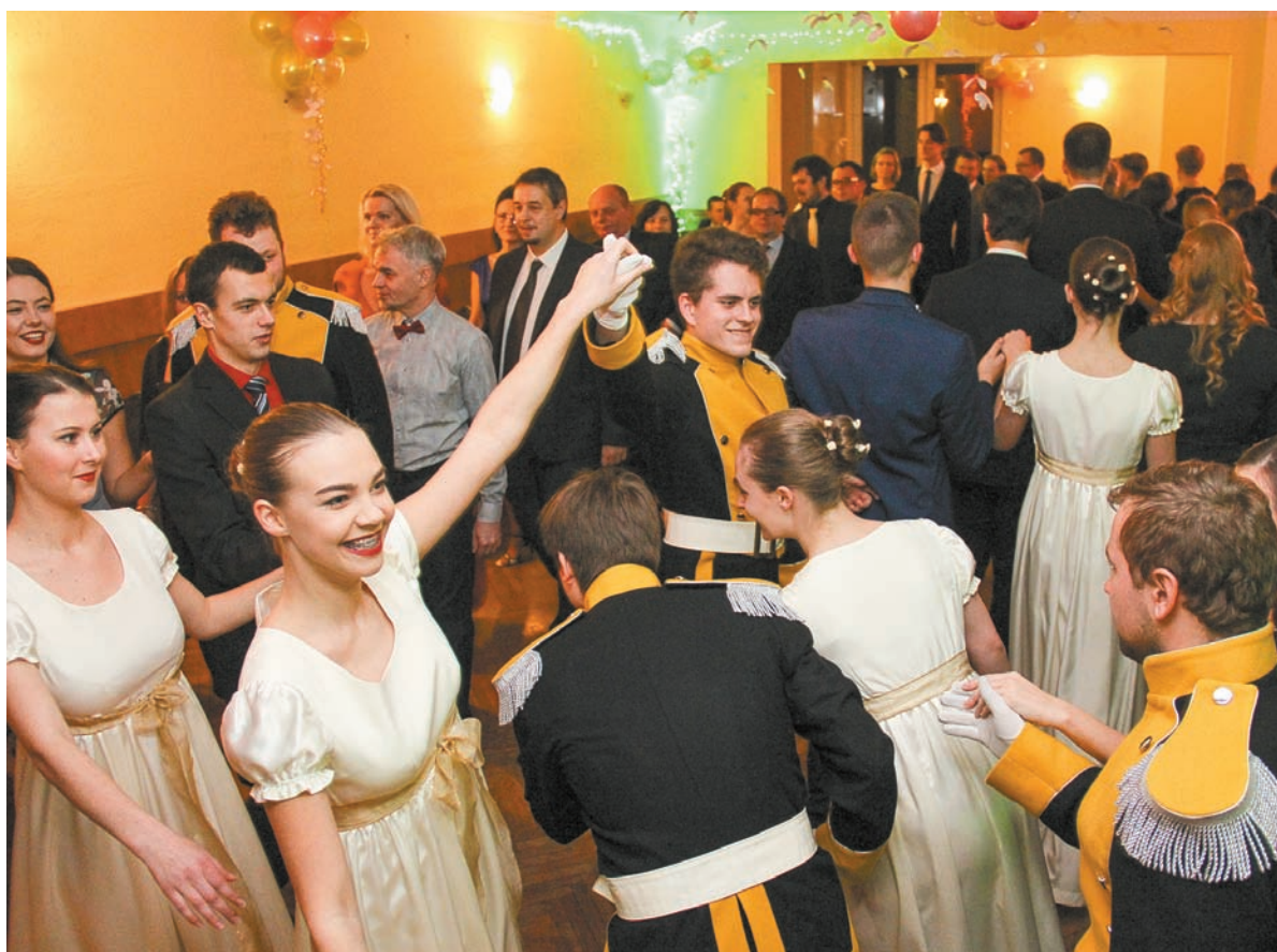
• Bystrzycki bal jak co roku rozpoczął się polonezem.