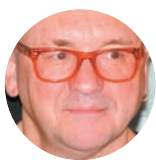
Jerzy Owsiak, prezes Wielkiej Orkiestry Świątecznej Pomocy

... Jedno serce zgasło, ale jednocześnie wiele serc się otworzyło. Tu w Gdańsku rozbłysło największe miasto świata. Biorę się 10 razy mocniej do roboty. Tak – będę grał z Orkiestrą, tak – będę prezesem Fundacji