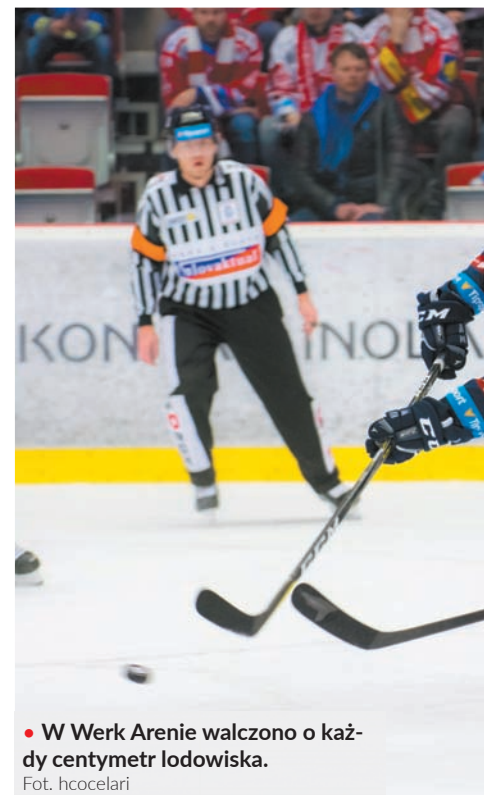
● W Werk Arenie walczone o każdy centymetr lodowiska.