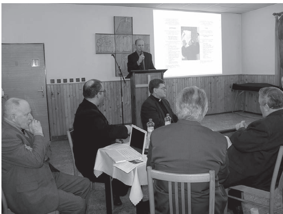
W Domu Zborowym w Nawsiu odbyła się w sobotę konferencja z udziałem przedstawicieli trzech wyznań chrześcijańskich.