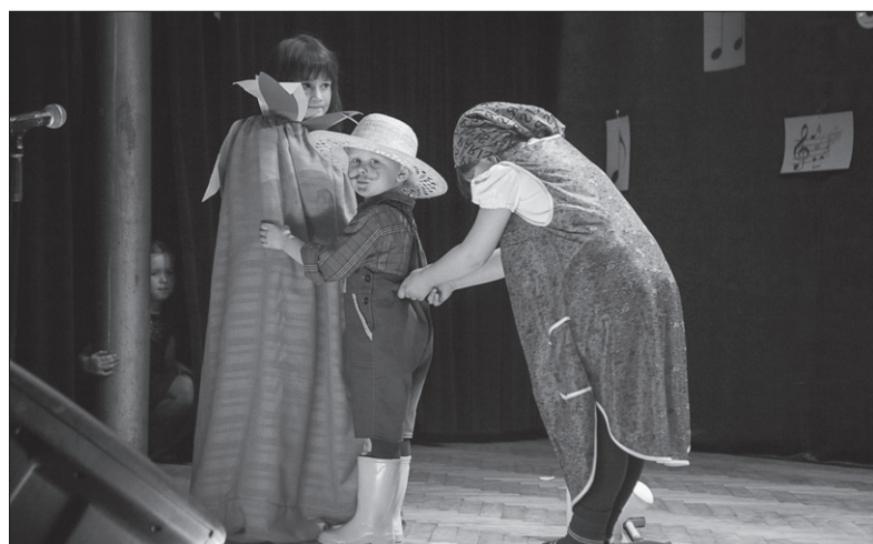
Inszenizacja wiersza Jana Brzechwy „Rzepka” w wykonaniu przedszkolaków.