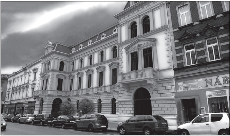
Tak ma wyglądać po remoncie siedziba muzeum przy ul. Głównej.

– Łączne straty zostały oszacowane na ponad 4 mln koron. W tej chwili budynek jest remontowany – poinformowała Iva Lupková, rzeczniczka placówki. Przypomnijmy, że 12 stycznia w budynku pękła rura na poddaszu i woda zalała wszystkie kondygnacje. Zniszczeniu uległy jedna z ekspozycji, sala wystawowa, depozyty biblioteki naukowej. Remontowany budynek przy ul. Praskiej w przyszłości nie będzie służył muzeum. Władze województwa, które jest właścicielem nieruchomości, prowadzą rozmowy o jej przekazaniu miastu. Ratusz liczy na to, że wykorzystany budynek do swoich potrzeb. Oprócz niepomyślnych wiadomości dyrekcja muzeum otrzymała w ub. tygodniu także wiadomość