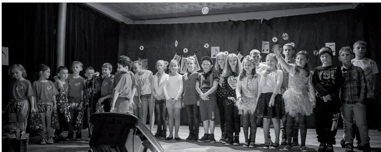
Wszyscy utalentowani występujący z polskiej podstawówki w Gródku.

Dzięki wielości pomysłów i różnorodności „dyscyplin” dzieciom udało się stworzyć dynamiczny program. Od razu po każdym występie zapowiedzianym w dowcipny sposób przez konferansjerów – pierwszo-