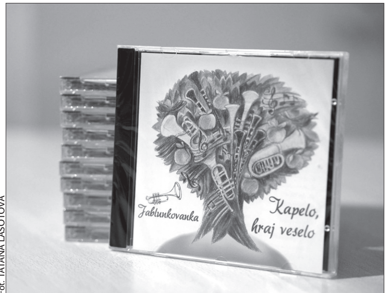
Fot. TAĀNA LASOTOVÁ

Płyta ma atrakcyjną okładkę, której autorem jest Pavel Kocur.