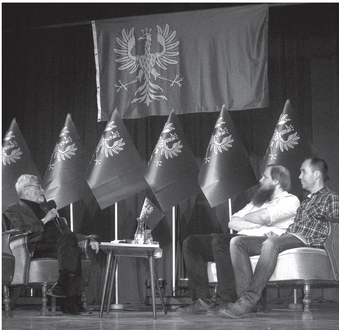
Flaga Księstwa Cieszyńskiego została oficjalnie zaprezentowana w Domu Narodowym w Cieszynie.

– Większość turystów bardzo sobie ceni opowieść o historii, ale także o lokalności. Opowieść wokół Księstwa Cieszyńskiego jest czymś, co może zachęcić turystów do zwiedzenia regionu, bo im coś bardziej jest lokalne, tym bardziej jest z punktu widzenia turysty ciekawsze.