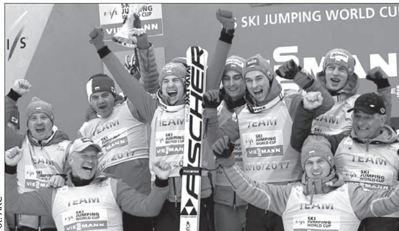
Polacy zdominowali w tym sezonie klasyfikację drużynową.