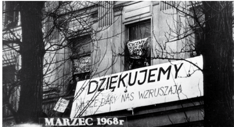
• Warszawa, marzec 1968. Transparenty wywieszone przez strajkujących studentów.