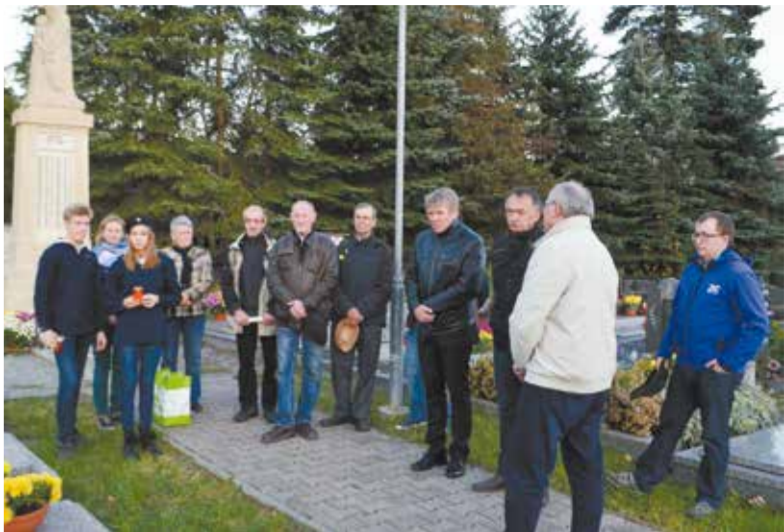
• Bystrzyczanie pamiętają o swych zasłużonych zmarłych.