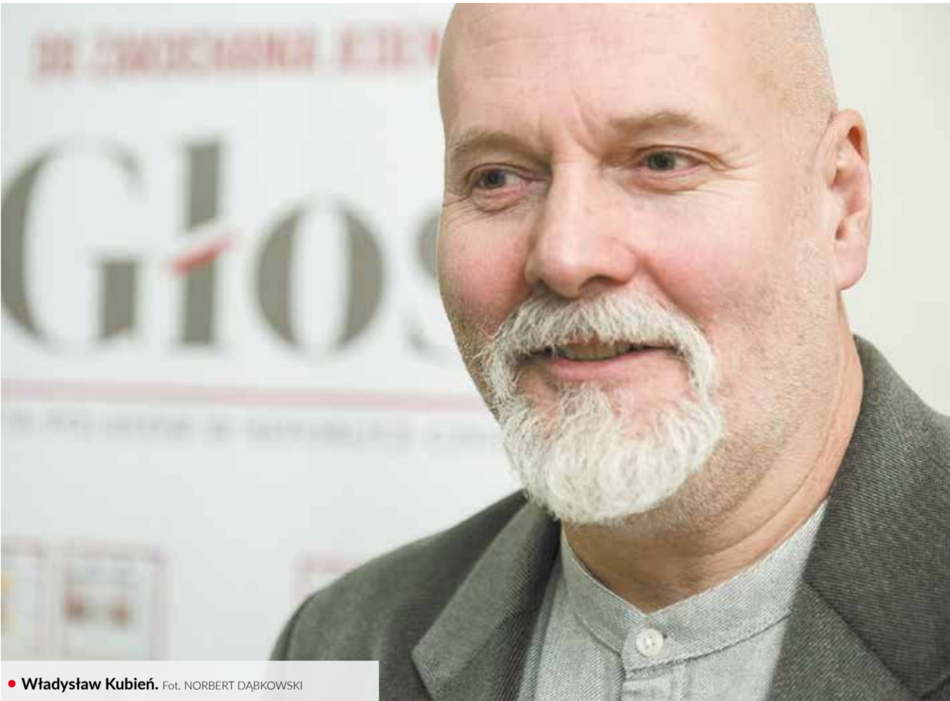
• Władysław Kubień.

Rozmowę z laureatami nagrody publiczności – zespołem Nonet – opublikujemy w „Głosie” na weekend.