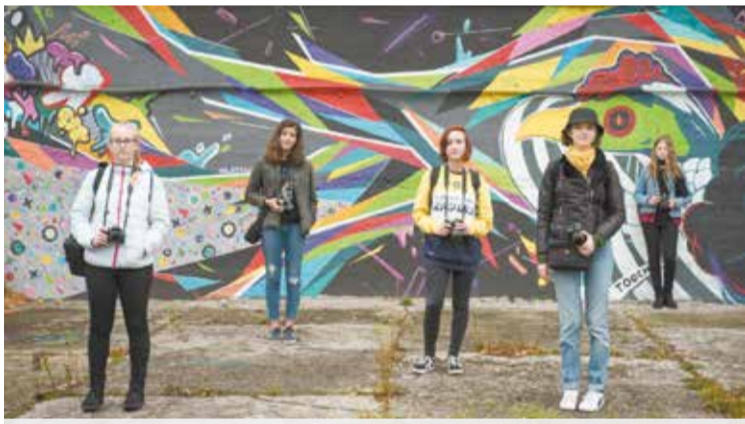
• Młodzie, co widać na załączonym obrazku, garną się do fotografii.

Zaolziańskie Towarzystwo Fotograficzne zorganizowało w sobotę dosyć nietypowy plener w Czeskim (i nie tylko) Cieszynie. Celem wydarzenia było zebranie grupy amatorów sztuki fotografii głównie wśród uczniów Polskiego Gimnazjum w Czeskim Cieszynie.