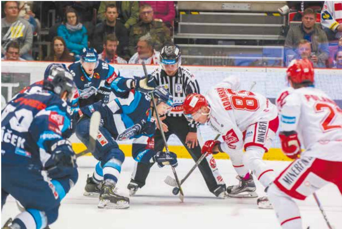
• Sztuka koncentracji.

Rzut oka na tabelę hokejowej Tipsport Ekstraligi i od razu robi się wesoło. Stalownicy Trzyniec po zwycięstwie nad Libercem zajmują w ekstraligowej stawce piąte miejsce. Oczko wyżej plasują się Witkowice, które pokonały na wyjeździe Pilzno. Taki krajobraz pozostanie z nami co najmniej do 16 listopada. Do tego czasu ekstraligowe rozgrywki pauzują z powodu startu reprezentacji RC w turnieju z cyklu Euro Hockey Tour.