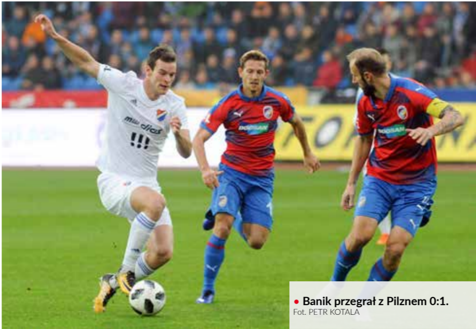
• Bankik przegrał z Pilznem 0:1.

w rzutach karnych. Decydującego gola zdobył w karnych Ondřej Roman, trafiając płasko w dolny róg pilźnieńskiej bramki. Zespół Witkowiec zdobył pilźnieńską arenę po dwóch latach oblężenia. – W Pilźnie żaden zespół nie ma łatwej przeprawy. Chylę czoła przed chłopakami – stwierdził szkoleniowiec Witkowiec, Jakub Petr. Przerwa w rozgrywkach pomoże ostrawskim hokeistom odzyskać stracone siły po zawirowaniach zdrowotnych. ▲