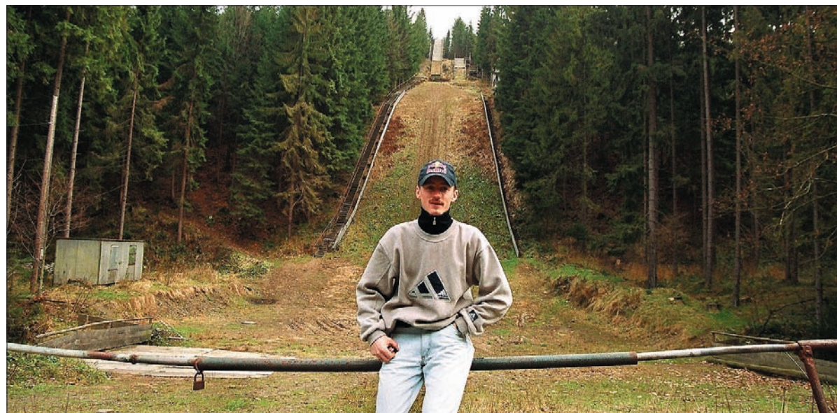
Skocznia w Wiśle-Labajowie. Tu Adam Małysz stawiał pierwsze sportowe kroki. Podczas jednego z treningów doszło do zabawnego wydarzenia: mały Adas wyskoczył dzielnie z progu, a wylądował kilka metrów dalej, w samych skarpetkach – buty z nartami zgubił gdzieś podczas lotu.