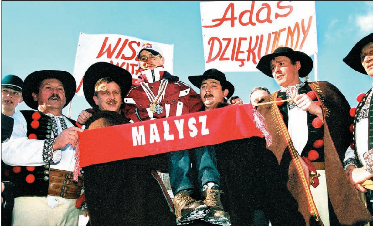
2001 rok. Adam Małysz po powrocie do rodzinnego miasta z Lahti jako mistrz świata.

bra olimpijskie Adama to dobra okazja, aby podsumować dokonania najsłynniejszego polskiego sportowca ostatnich lat. My postanowiliśmy zrobić to prezentując wybrane, niektóre dotąd niepublikowane zdjęcia z wicemistrzem olimpijskim w roli głównej. (two)