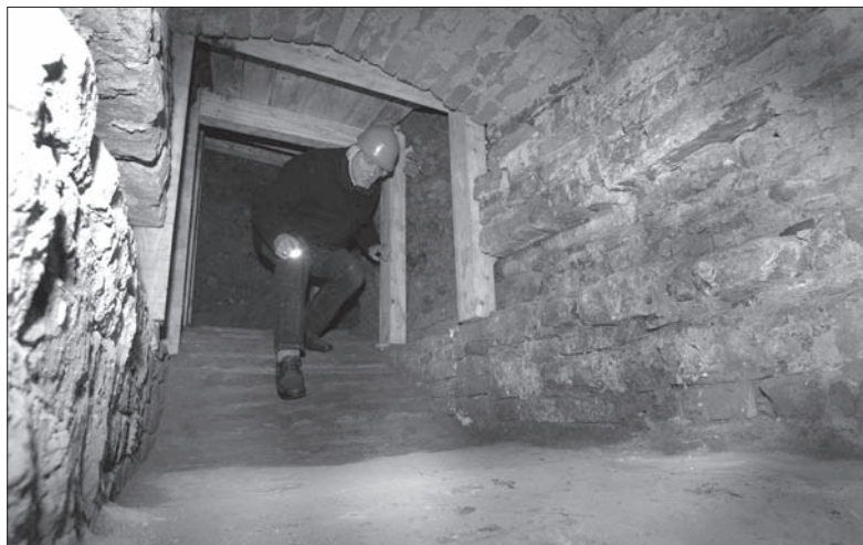
Tajemnicze przejście odsłonięto w jednej z piwnic browaru.

Cieszyński browar otwarto w 1846 roku, 10 lat przed słynnym browarem w Żywcu. Obecnie oba wchodzi w skład Grupy Żywiec, należącej do holenderskiego koncernu Heineken. (gc)