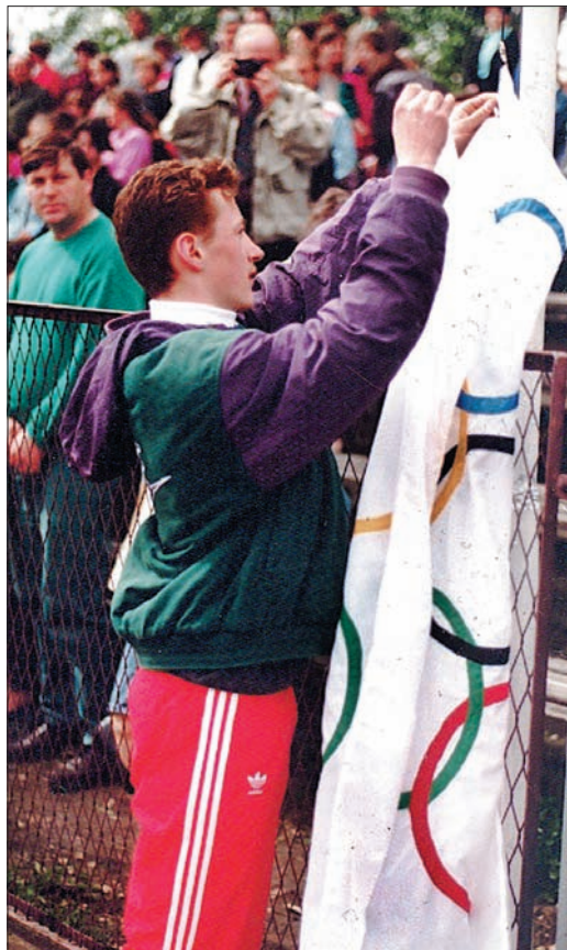
1996 rok. Jeszcze jako mało znany skoczek wiesz flagę olimpijską podczas inauguracji Olimpiady Młodzieży Ewangelickiej w Skoczowie. Wtedy nawet nie marzył o wyjeździe na prawdziwe igrzyska...