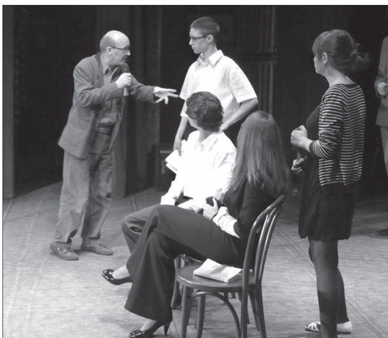
Artur Barciś jest częstym gościem cieszyńskiego teatru. Na zdjęciu podczas zajęć z młodzieżą.