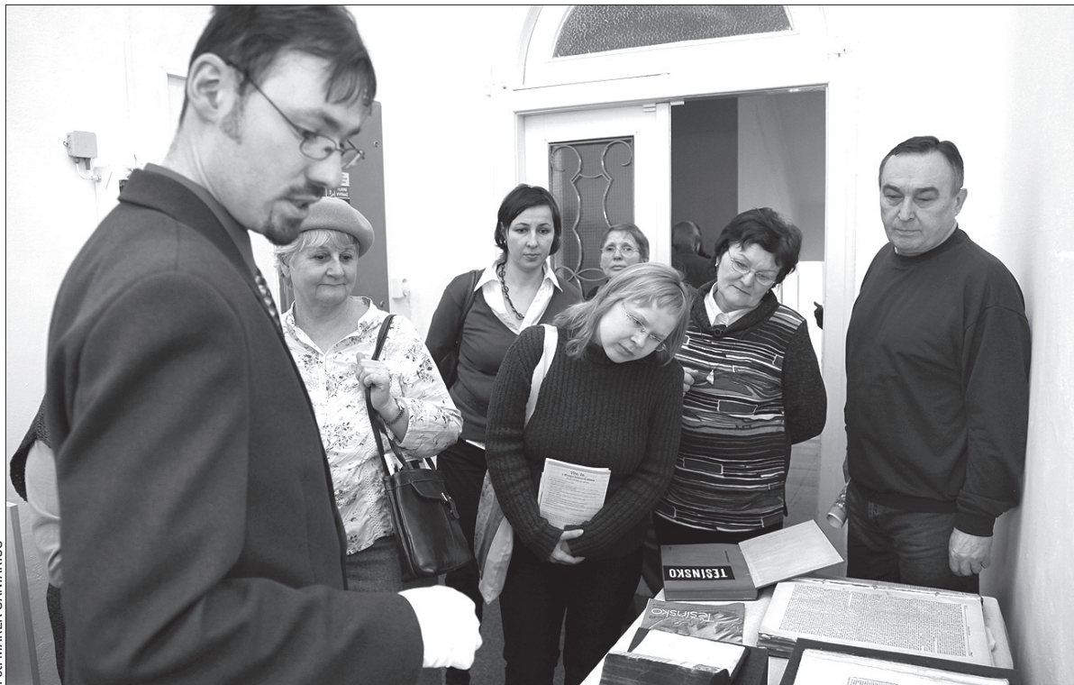
Biblioteka Silesia pisze od kilku dni nowy rozdział swej historii.