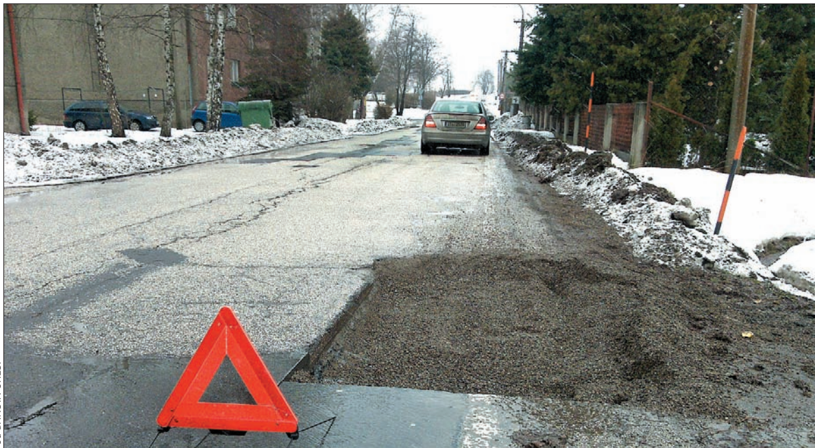
W tę dziurę w Hawierzowie-Sucej w sobotę samochód.