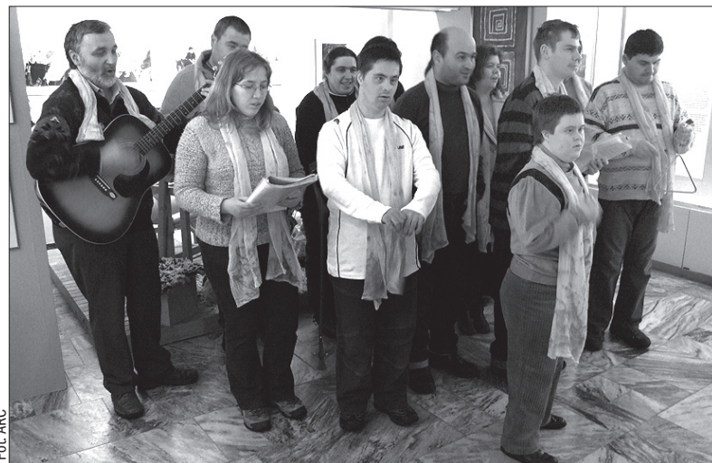
Na wernisażu wystąpili klienci ośrodka dziennego Eden Diakonii Śląskiej w Czeskim Cieszynie.

Również ich organizacja – Stowarzyszenie Pomocy Osobom z Upośledzeniem Mentalnym – obchodzi w tym roku swe 20-lecie. Inicjatorką jego założenia była matka dziewczynki z Czeskiego Cieszyna, która urodziła się z zespołem Downa. Dziś stowarzyszenie liczy 81 członków. Urządza obozy letnie i inne imprezy sportowe i kulturalne z myślą o niepełnosprawnych. Wystawę można zwiedzać codziennie, oprócz poniedziałków, do 11 kwietnia br. (dc)