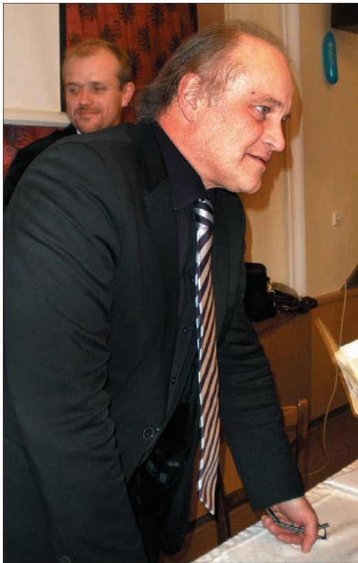
Minister wysłuchał wszystkich poglądów – również po oficjalnym zakończeniu imprezy.

Seminarium edukacyjne nt. dwujęzyczności zwołały Komisja ds. Mniejszości Narodowych przy Urzędzie Gminy w Śmiłowicach oraz Miejsce Koło Polskiego Związku Kulturalno-Oświatowego. Przybyło na nie, prócz mieszkańców gminy, wiele osób z innych miejscowości regionu – m.in. wójtowie sąsiednich gmin, dyrektorzy szkół, przedstawiciele organizacji Matice Slezská. To oni najgorzej wystąpili w dyskusji, obwiniając polską stronę o nacjonalizm, pogarszanie wzajemnych stosunków i celowe podsycanie konfliktu w mediach.