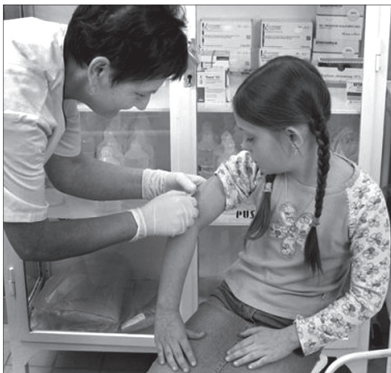
Szczepienie przeciwko gruźlicy ponownie jest opłacane przez ubezpieczalnie zdrowotne.

W większości krajów europejskich, w tym w Republice Czeskiej i w Polsce, nie trzeba się gruźlicy specjalnie obawiać. Sytuacja epidemiologiczna jest raczej dobra. Mimo wszystko liczba zachorowań z roku na rok powoli rośnie – najprawdopodobniej