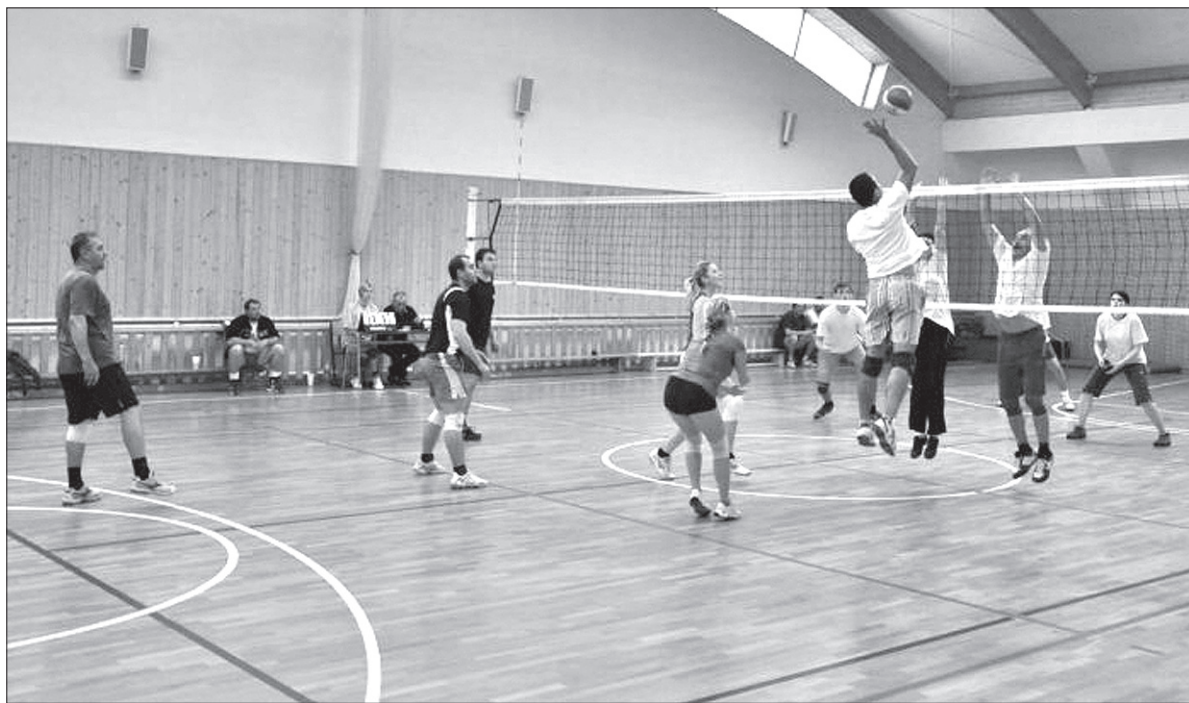
Mecze stały na zaciętym poziomie.