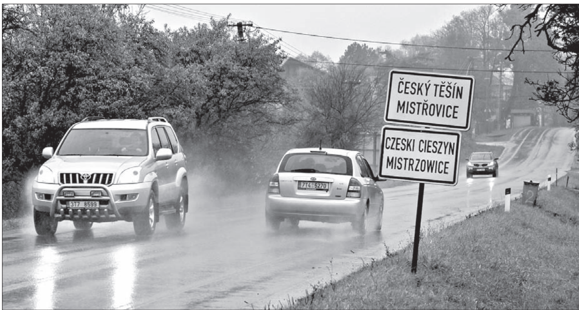
Czytelny polski napis na tablicy wjazdowej do Mistrzowic to zasługa Jana Walicy.

Tym razem postanowił wykorzystać ściereczki na wyczyszczenie tablicy w Mistrzowicach. W poniedziałek ok. 16.30 podjechał samochodem przed tablicę. – Na szczęście polski napis jest umocowany dosyć nisko, bez problemu mogłem go dosięgnąć. Zużyłem cztery ściereczki