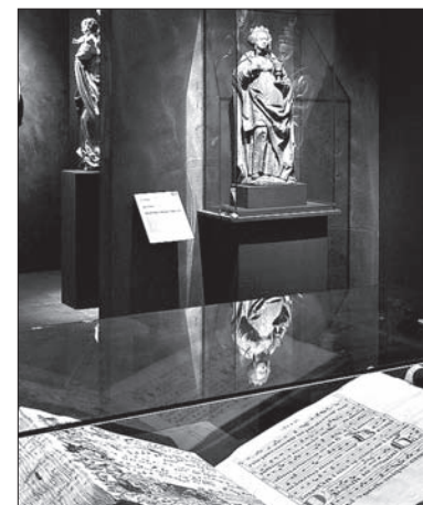
Fragment wystawy w Kutnej Horze.

Wystawa jest już w toku przygotowań w Zamku Królewskim i Muzeum Narodowym w Warszawie. (o)