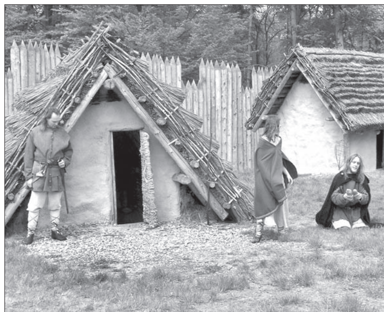
Wśród projektów-szczęściarzy, które dostaną szczodre dofinansowanie z funduszy europejskich, jest na przykład Archeopark w Kocobędzu-Podborze.

eparku w Kocobędzu-Podborze powstanie przy wejściu nowy, wielofunkcyjny budynek, wybudowana zostanie kładka łącząca go z grodziskiem, pojawią się też dwie nowe repliki słowiańskich zabudowań mieszkalnych i mały park linowy, a także nowy parking. Na pieniądze mogą liczyć także park leśny przy sanatorium w Klimkowicach czy ścieżka edukacyjna we Frenszacie pod Radhoszczem. Wśród rezerwowanych jest na przykład rozbudowa parku w sanatorium w Jabłonkowie i remont Katedry Bożego Zbawiciela w Ostrawie. (ep)