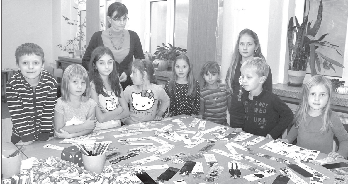
Dzieci ze świetlicy szkolnej wykonały niespełna 100 zakładkę do książek.

Niedawno do Polskiej Szkoły Podstawowej w Czeskim Cieszynie dotarła wyjątkowa przesyłka ze Słowacji. Było w niej niespełna 100 zakładerek do książek, własnoręcznie wykonanych przez dzieci ze szkoły podstawowej w miejscowości Trstená.