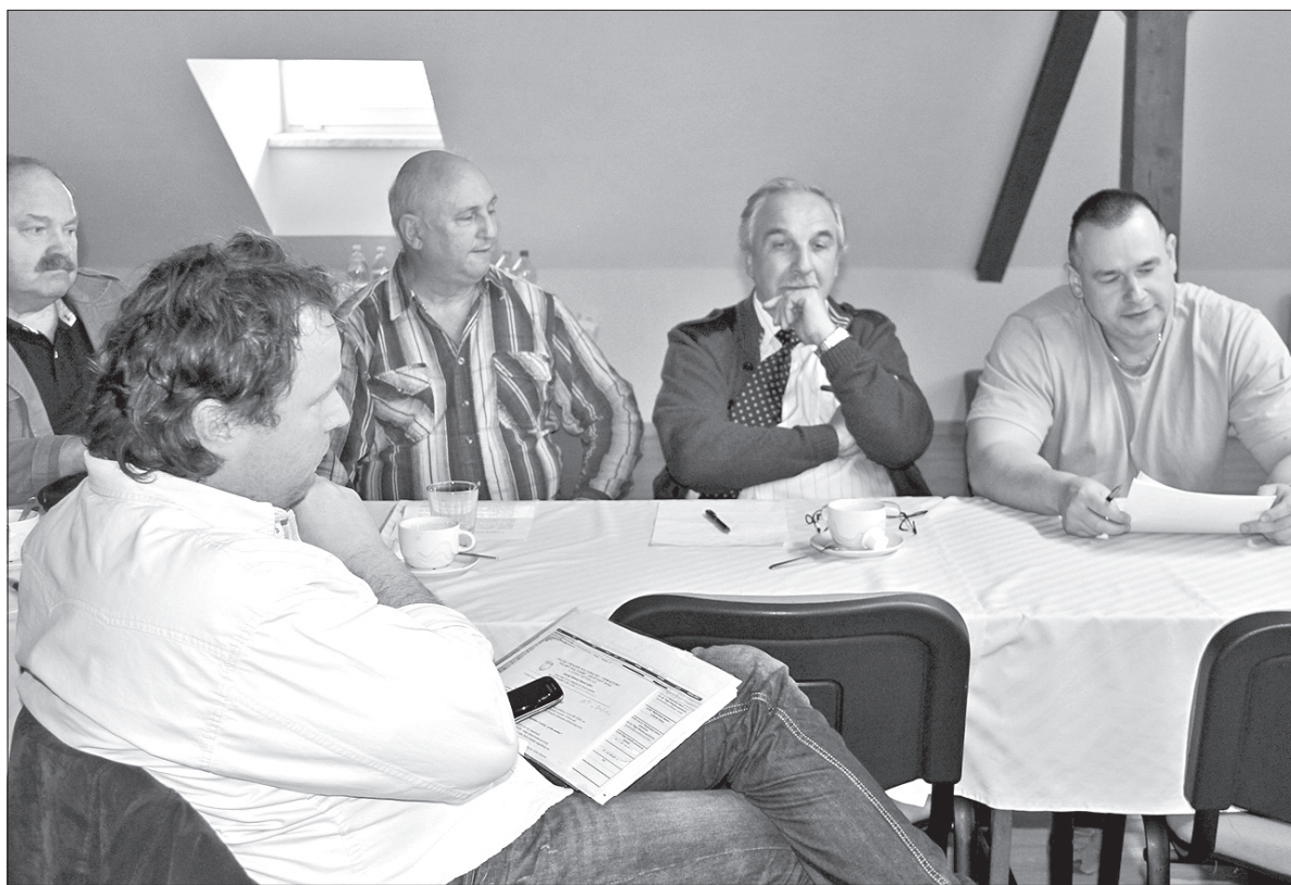
Okrągły Stół w ZG PZKO w Czeskim Cieszynie.

gotowanie tematów i podtematów oraz tematów długofalowych i krótkofalowych, a następnie zajęcie się poszczególnymi tematami w grupach.