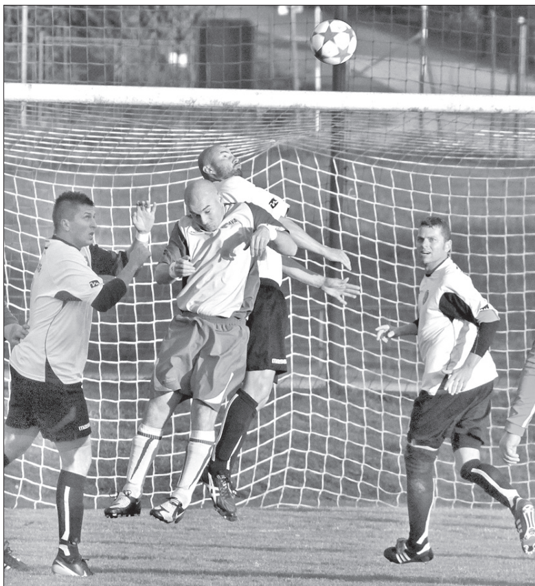
Piłkarze Olbrachcic poculi się jak w bajce.

Lokaty: 1. Szonów 25, 2. Olbrachcice 24, 3. Stonawa 20,... 10. Lutynia Dolna 14, 13. Bystrzyca 8, 14. ČSAD Hawierzów 6 pkt. (jb)