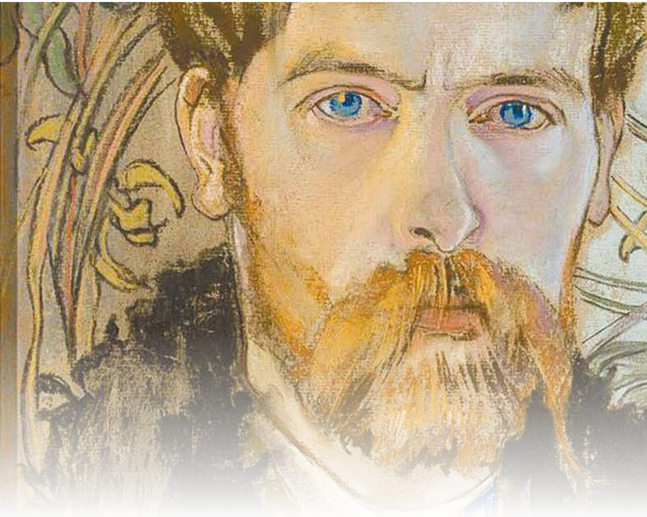
• Autoportret z 1904 roku.