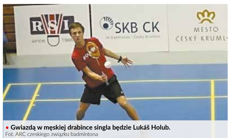
• Gwiazdą w męskiej drabince singla będzie Lukáš Holub.

Główna drabinka rozpoczyna walkę w sobotę 12 stycznia, mecze półfinałowe i finałowe odbędą się w niedzielę. Cieszyński Puchar został ponownie zarezerwowany do prestiżowej kategorii GPA przeznaczonej dla pięciu najlepszych turniejów w ramach Republiki Czeskiej. (jb)