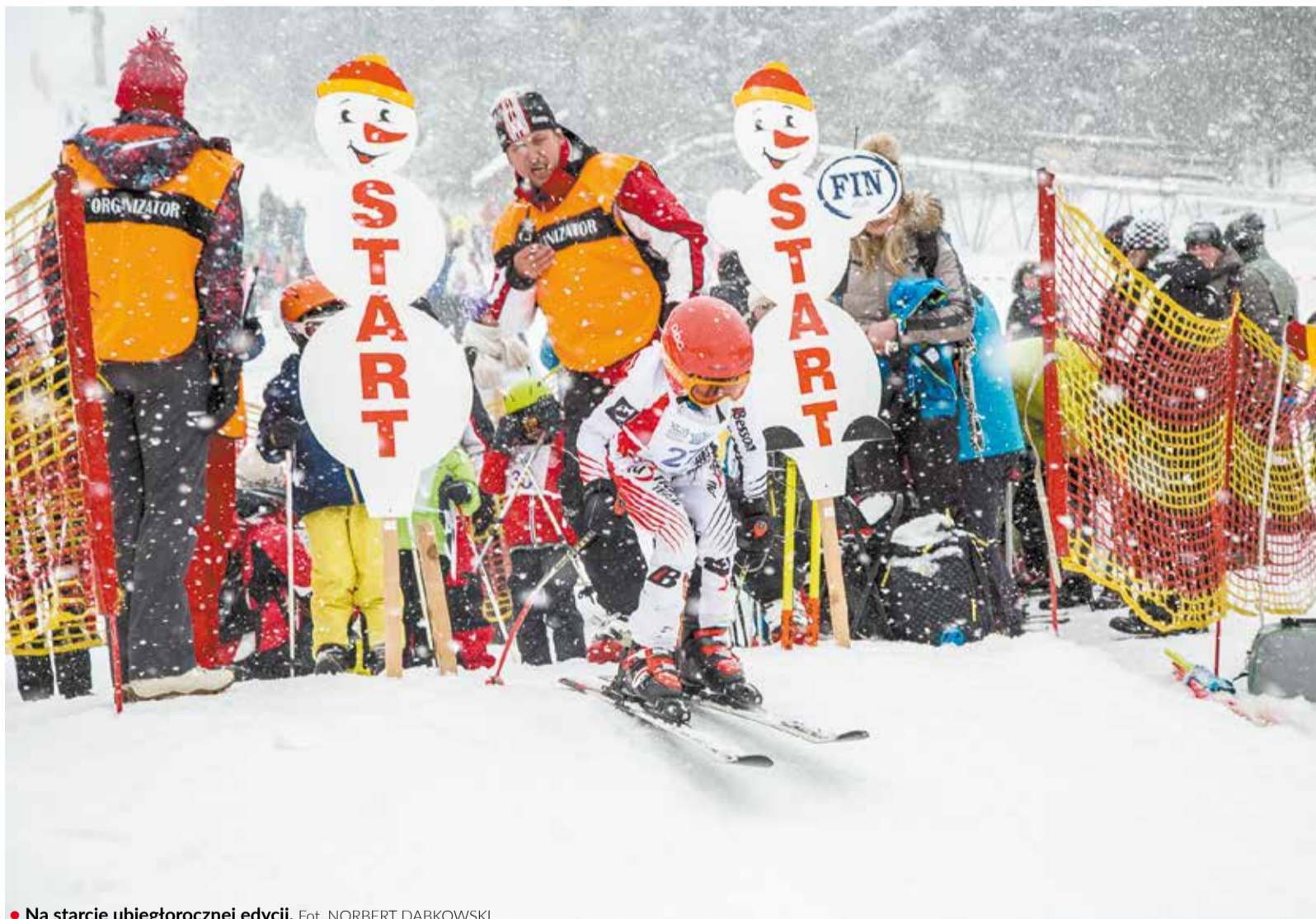
• Na starcie ubiegłorocznej edycji.