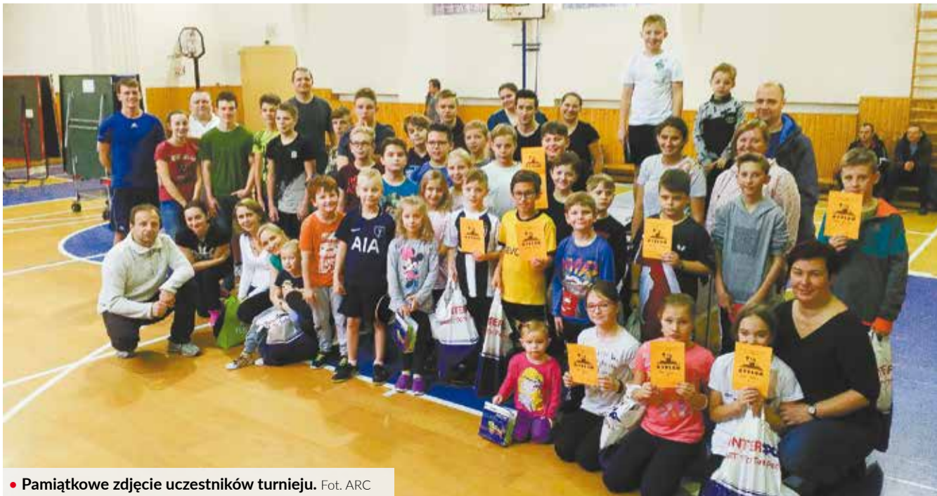
• Pamiątkowe zdjęcie uczestników turnieju.

Jak podkreślili w liście nadesłanym do naszej redakcji uczestnicy turnieju, fajnie było się poruszać i spalić zbędne kalorie po świętach. Dla zwycięzców przygotowano nagrody rzeczowe i dyplomy. (jb)