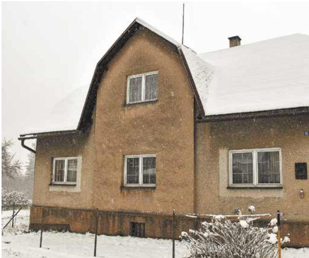
• W tym domu urodził się Stanisław Hadyna.