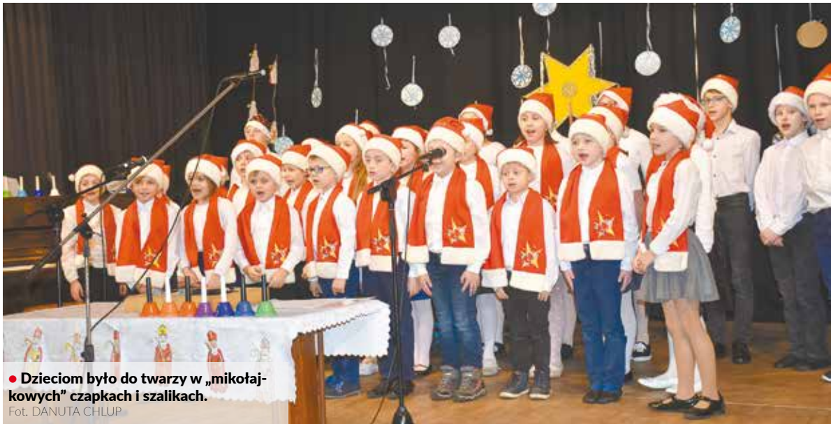
• Dzieciom było do twarzy w „mikołajkowych” czapkach i szalikach.