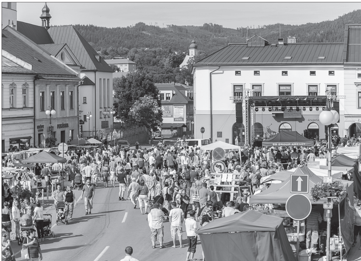
Rynek Mariacki wypełnił się w niedzielę mieszkańcami i turystami.