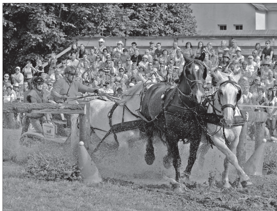
Najbardziej spektakularna kategoria – wyścig czterokonnych zaprzęgów.