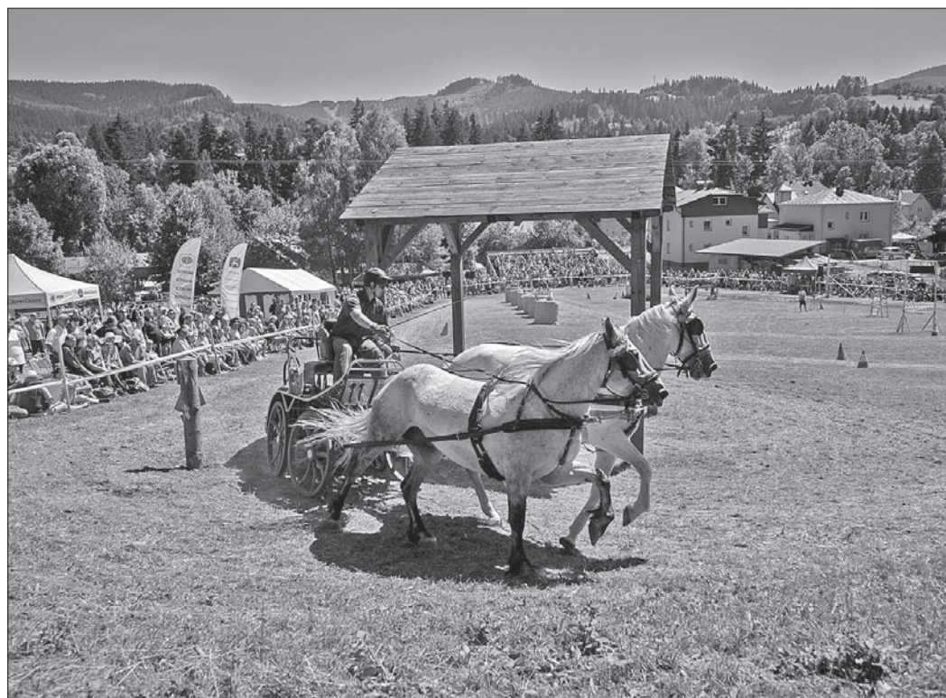
Najwięcej trudności zawodnikom sprawiały ostre zakręty.