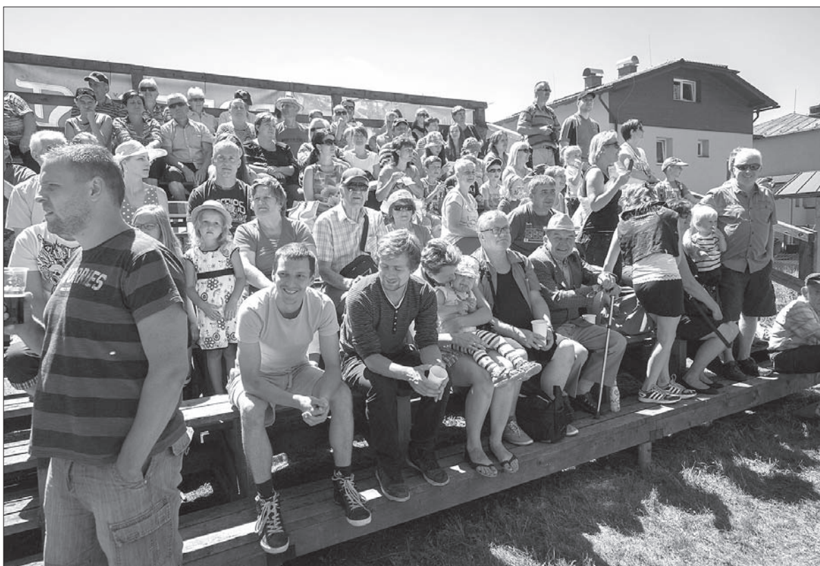
Publiczność jak zawsze dopisała i z napięciem śledziła przebieg zawodów.