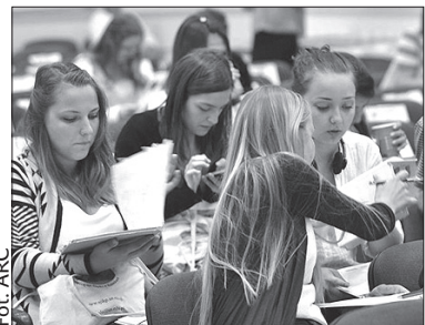
Tradycyjnie do Cieszyna przyjadą cudzoziemcy praktycznie z całego świata.