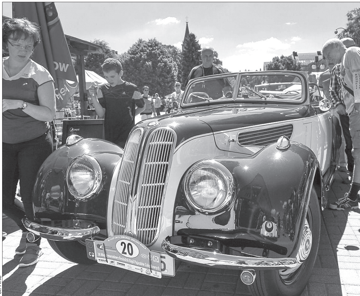
Po raz kolejny stare samochody opanowały Beskidy. Od czwartku do niedzieli odbywał się tu 38. Międzynarodowy Beskidzki Rajd Pojazdów Zabytkowych. Bazą rajdu było Jaworze, a „weterany” można było spotkać między innymi w sobotę w Wiśle.