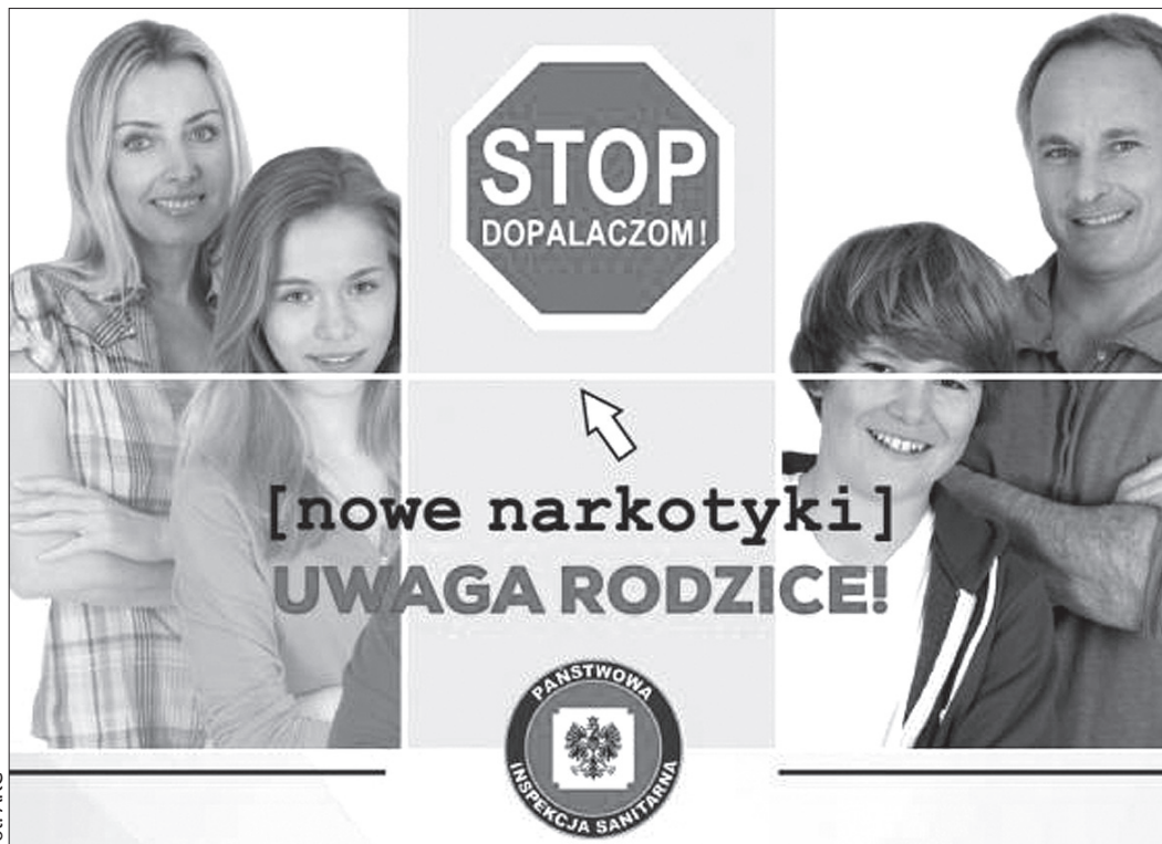
Przed dopalaczami przestrzega między innymi ulotka wydana przez sanepid.

Jeszcze w sobotę śląskim policjantom udało się zatrzymać w jednej z kamienic w Katowicach 59-letnią kobietę i 26-letniego mężczyznę. W ich mieszkaniu policjanci znaleźli 144 gramy „Mocarza”. W niedzielę do zatrzymanych dołączyła trójka mieszkańców Bytomia. Dwie kobiety w wieku 44 i 48 lat oraz 32-letni mężczyzna mieli w mieszkaniu 30 gramów „Mocarza” i prawie 15 tysięcy złotych, które najprawdopodobniej pochodzą z handlu dopalaczami. Bytomian udało się ująć dzięki informacjom od 14- i 17-latkę,