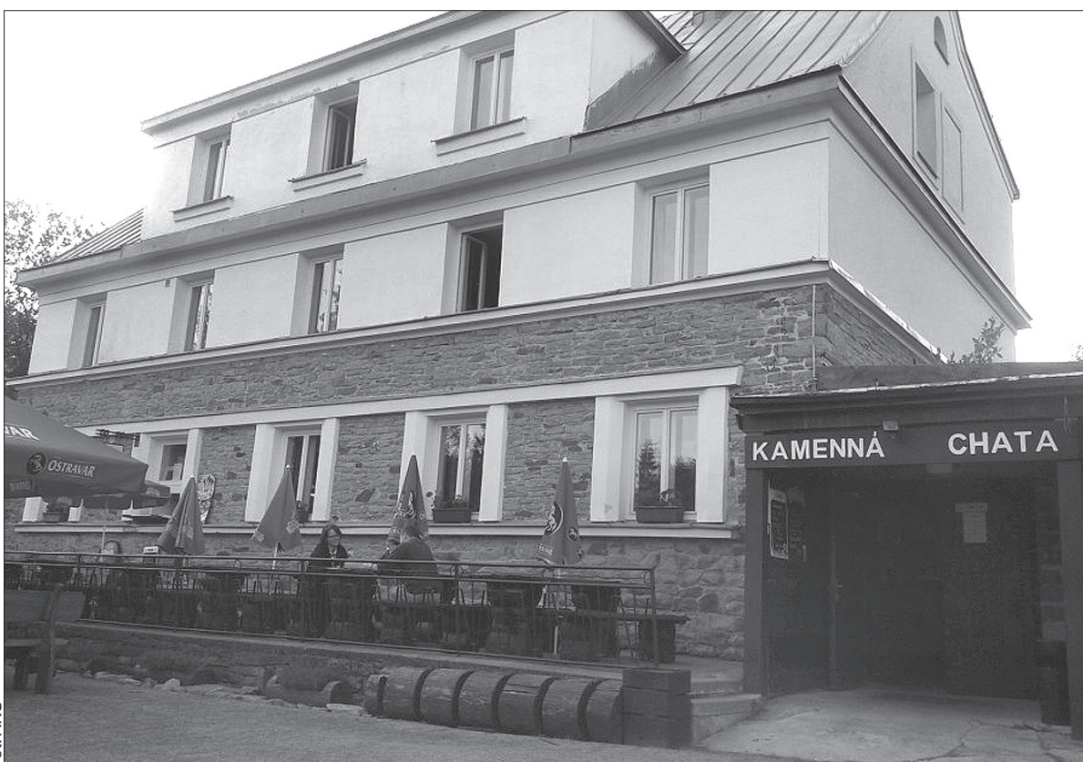
Kamienna Chata na Wielkim Połomie.