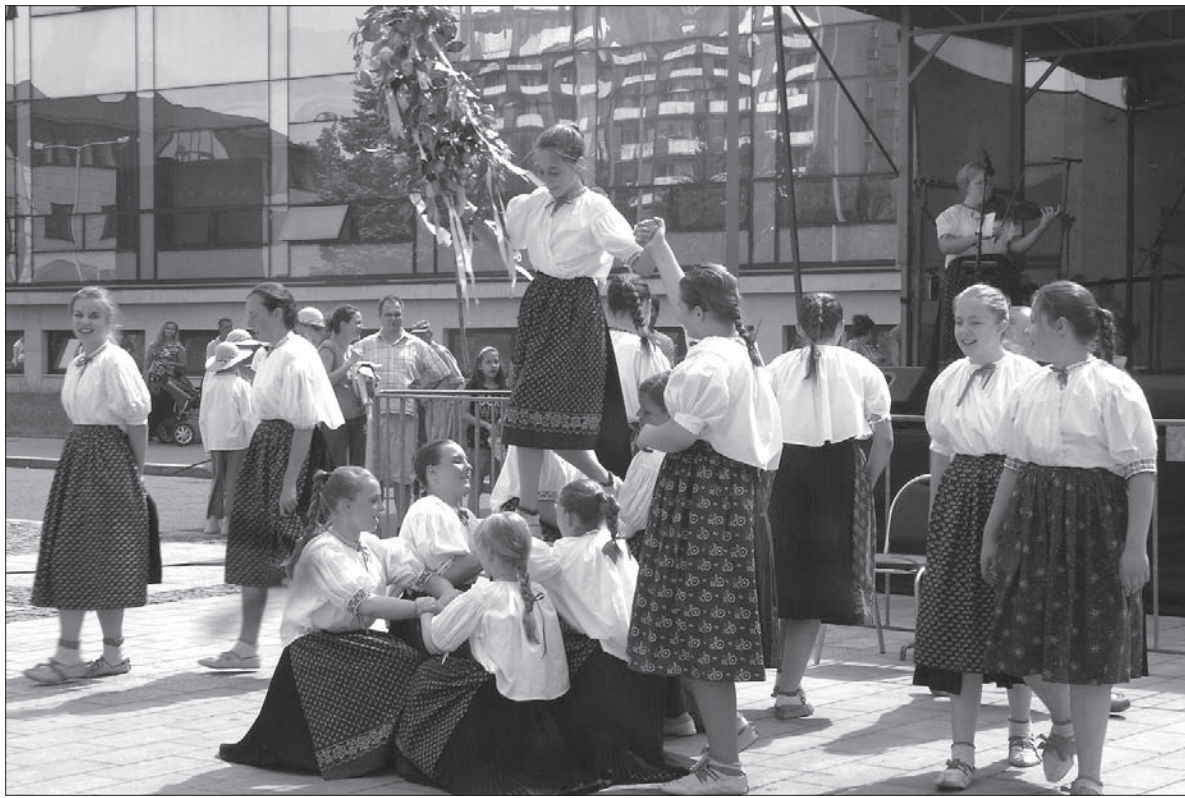
Obrazek beskidzki ze zwyczajem „chodzenia z goiczkim”.

– Bardzo sobie cenimy współpracę z Trzyńcem, dlatego cieszę się, że na tej imprezie zagrała również Grupa