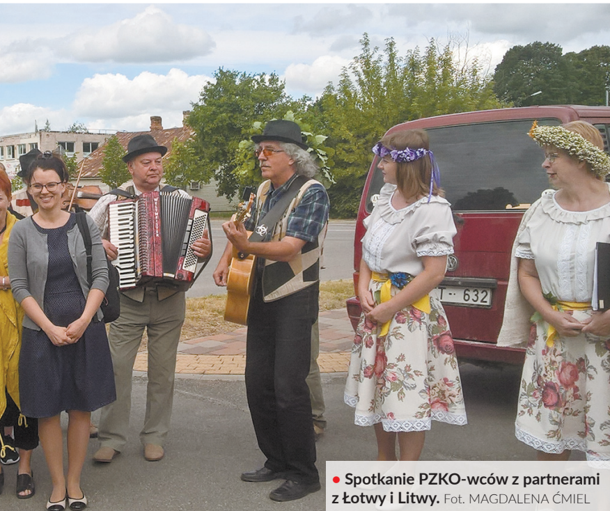
• Spotkanie PZKO-wców z partnerami z Łotwy i Litwy.

myślą o dorosłych użytkownikach mających kłopoty z obsługą nowoczesnych technologii, ale też ze słownictwem technicznym. Platforma udostępniona zostanie w połowie lipca.