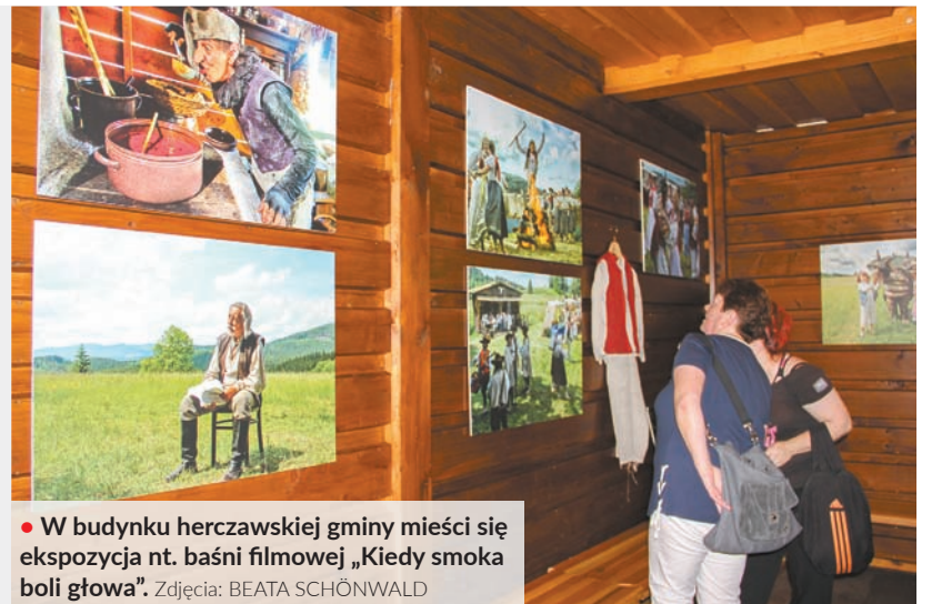
• W budynku herczawskiej gminy mieści się ekspozycja nt. baśni filmowej „Kiedy smoka boli głowa”.