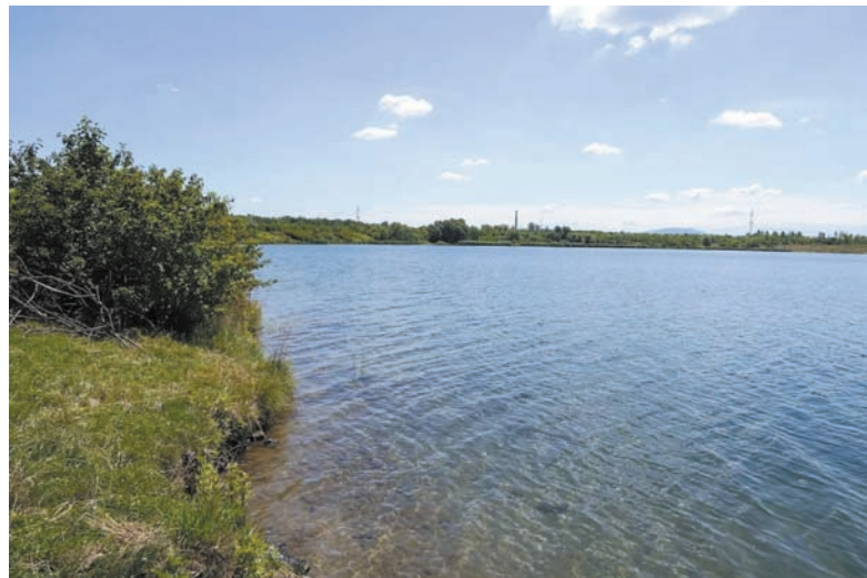
• Na brzegach zbiornika ma powstać strefa wypoczynkowa z prawdziwego zdarzenia.

Stworzenie strefy rekreacyjnej wokół Karwińskiego Morza leży na barkach miejskiej spółki STaRS Karwina. Pierwsze kroki, jak posprzątać i uporządkowanie terenu wokół zbiornika, zainstalowanie koszy na śmieci oraz