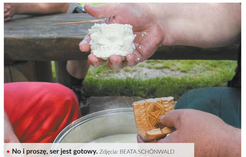
• No i proszę, ser jest gotowy.

Do filcowania wełny na sucho potrzebna jest specjalna igła z ząbkami, które przeplatają poszczególne włókna wełny między sobą. Aby produkt filcowania miał konkretny kształt, wełnę wkłada się do małych foremek na świąteczne ciasteczka. Wełnę kładzie się po kawałkach i ubija igłą. Najpierw robi się podstawę z naturalnej wełny, a następnie ozdabia się ją wełną farbowaną.