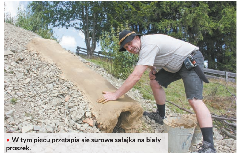
• W tym piecu przetapia się surowa sałajka na biały proszek.