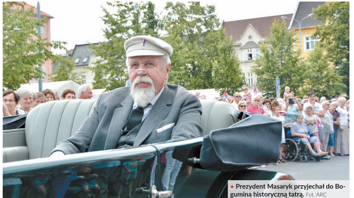
• Prezydent Masaryk przyjechał do Bogumina historyczną tatrą.