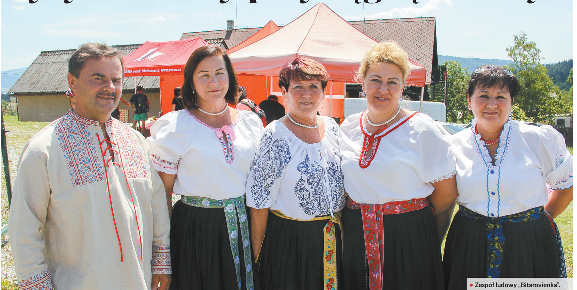
• Zespół ludowy „Bitarovienka”.

Na Herczawie obchodzono w czwartek odpust ku czci świętych Cyryla i Metodego. Uroczystość ta jak co roku przyciągnęła do wsi leżącej na trójstyku trzech krajów – Czech, Polski i Słowacji – tłumy.