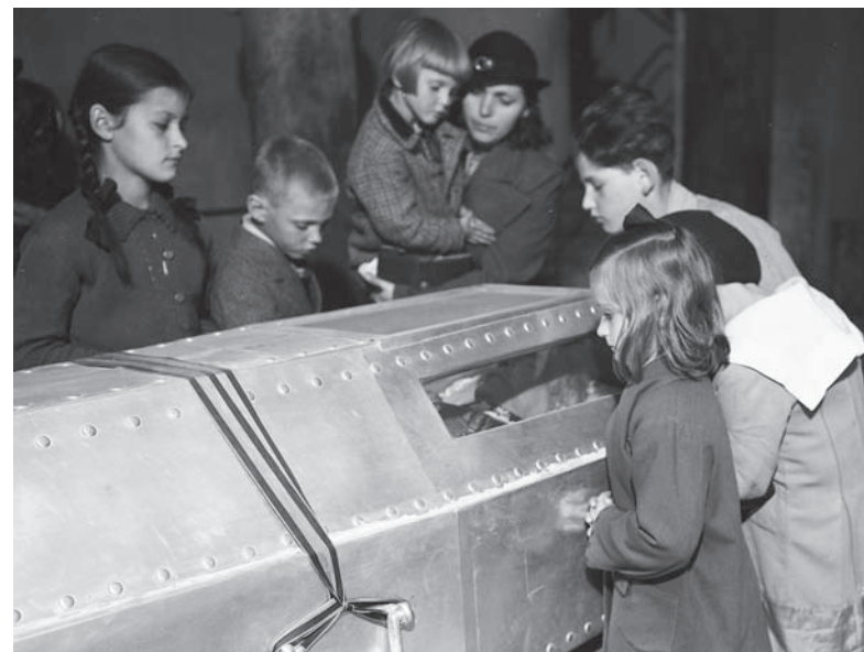
• Kraków, maj 1935. Dzieci przy sarkofagu marszałka Józefa Piłsudskiego w krypcie św. Leonarda na Wawelu.

W dzień defilady pogrzebowej (...) oczy skierowały się w stronę Generalnego Inspektora Sił Zbrojnych Rydza-Śmigłego i w stronę stojące-