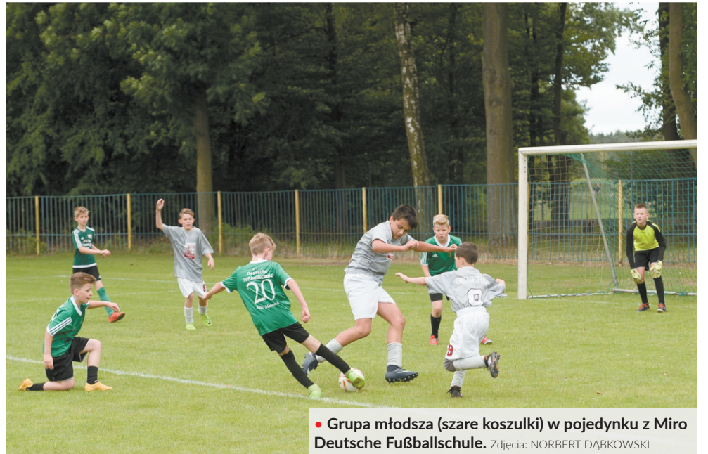
• Grupa młodsza (szare koszulki) w pojedynku z Miro Deutsche Fußballschule.