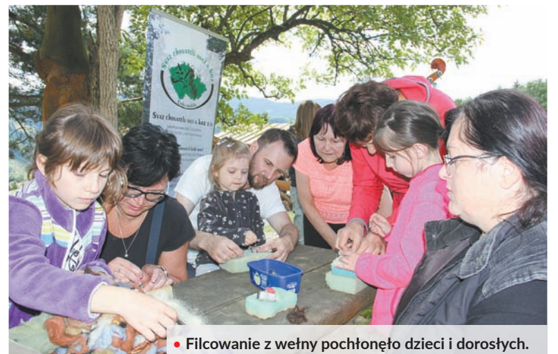
• Filcowanie z wełny pochłoneło dzieci i dorosłych.