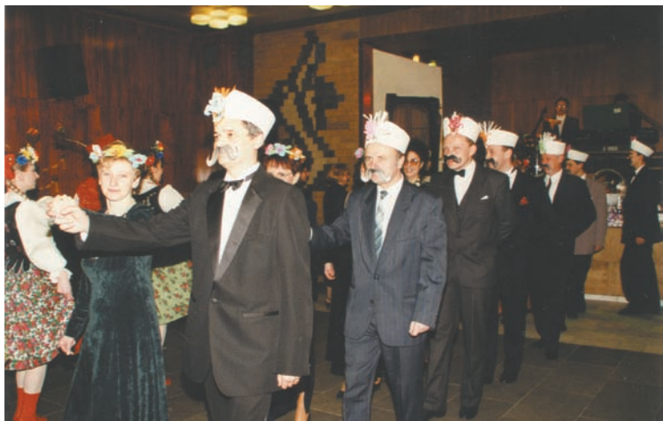
• Bal MK PZKO w Skrzeczoni pt. „W karczmie pana Twardowskiego”. Który to był rok? Może ktoś z Czytelników podpowie...