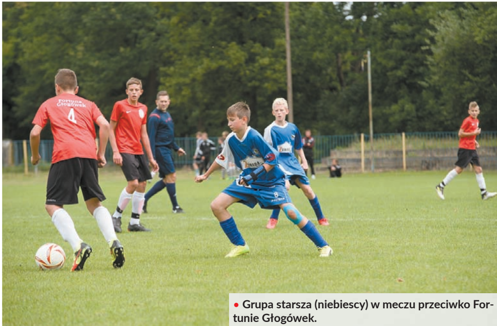
• Grupa starsza (niebiescy) w meczu przeciwko Fortunie Głogówek.

W ostatnią sobotę czerwca klub piłkarski Spartak z Jabłonkowa ponownie wyruszył na zagraniczne wojaże. Tym razem nie tak daleko, bo do Krapkowic pod Gogolinem, gdzie odbył się Młodzieżowy Turniej Piłkarski Mniejszości Narodowych, Fussballiada 2018.