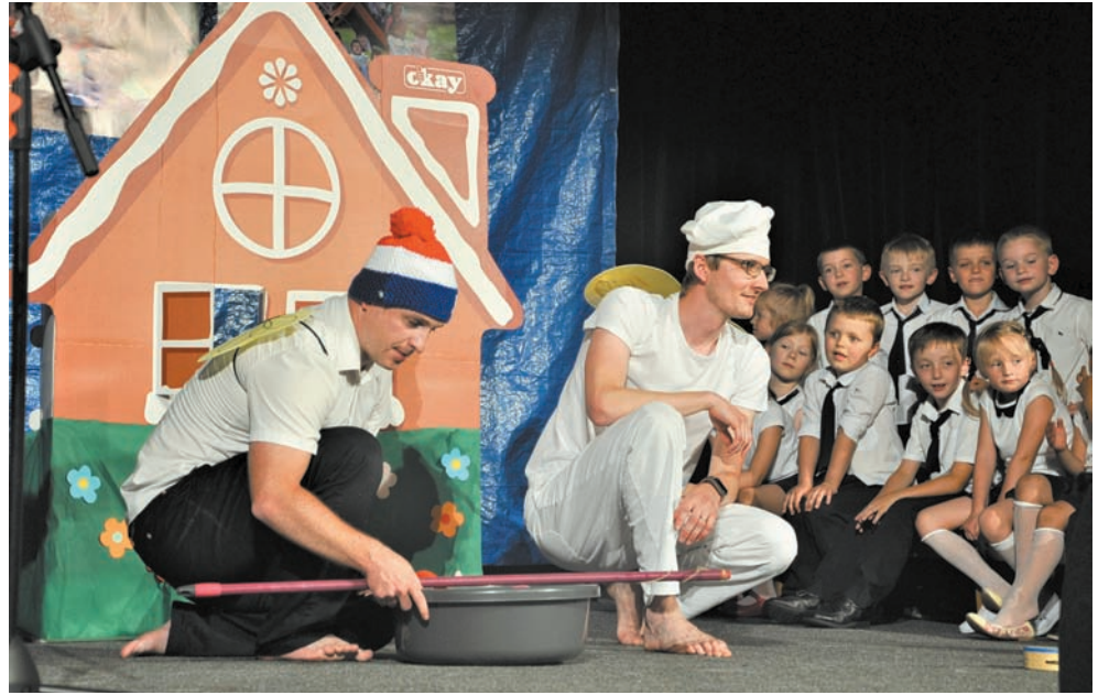
• Dzieci z Przedszkola Wesołych Przygód. Po prawej rodzice w akcji.