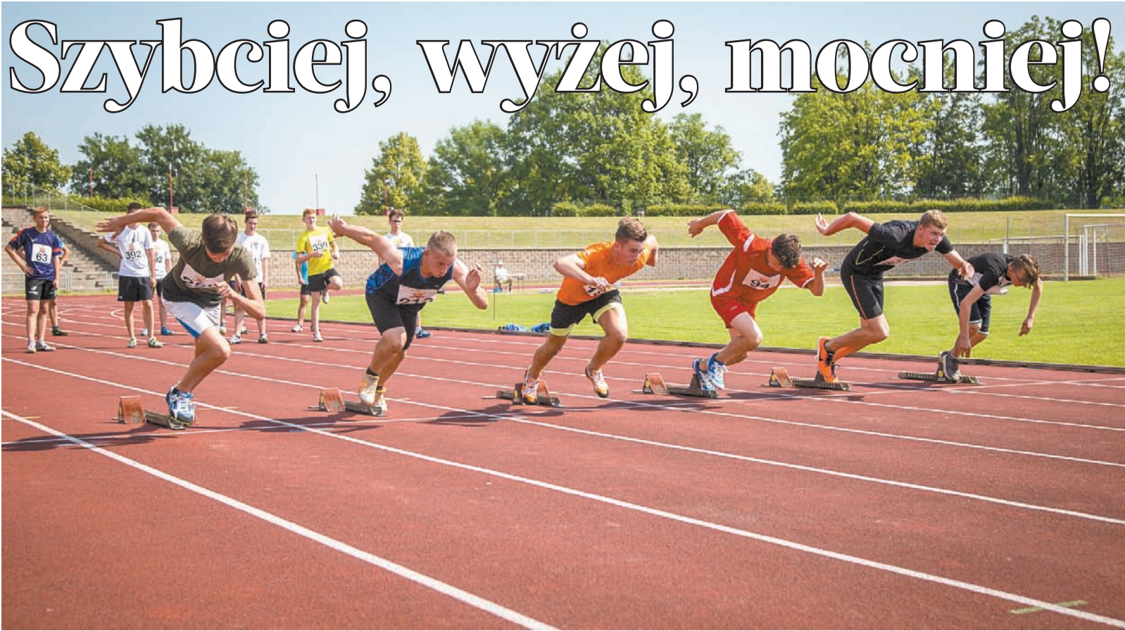
• W naszych polskich szkołach nie brakuje utalentowanej sportowo młodzieży. Po raz kolejny przekonaliśmy się o tym w piątek podczas XXXVI Igrzysk Lekkoatletycznych polskich szkół podstawowych. Na stadionie przy ul. Leśnej w Trzyczcu oklaskiwano sportowców z prawie wszystkich placówek. Więcej na str. 8-9. (jb)