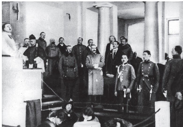
• Warszawa, 10 lutego 1919. Otwarcie Sejmu Ustawodawczego. W środku widoczny Naczelnik Państwa Józef Piłsudski.

Starałem się osiągnąć swój cel jak najspieszniej. Chciałem bowiem, by – kładąc trwałe fundamenty pod swe odrodzenie – Polska wyprzedziła sąsiadów i w ten sposób stała się siłą przyciągającą, dającą