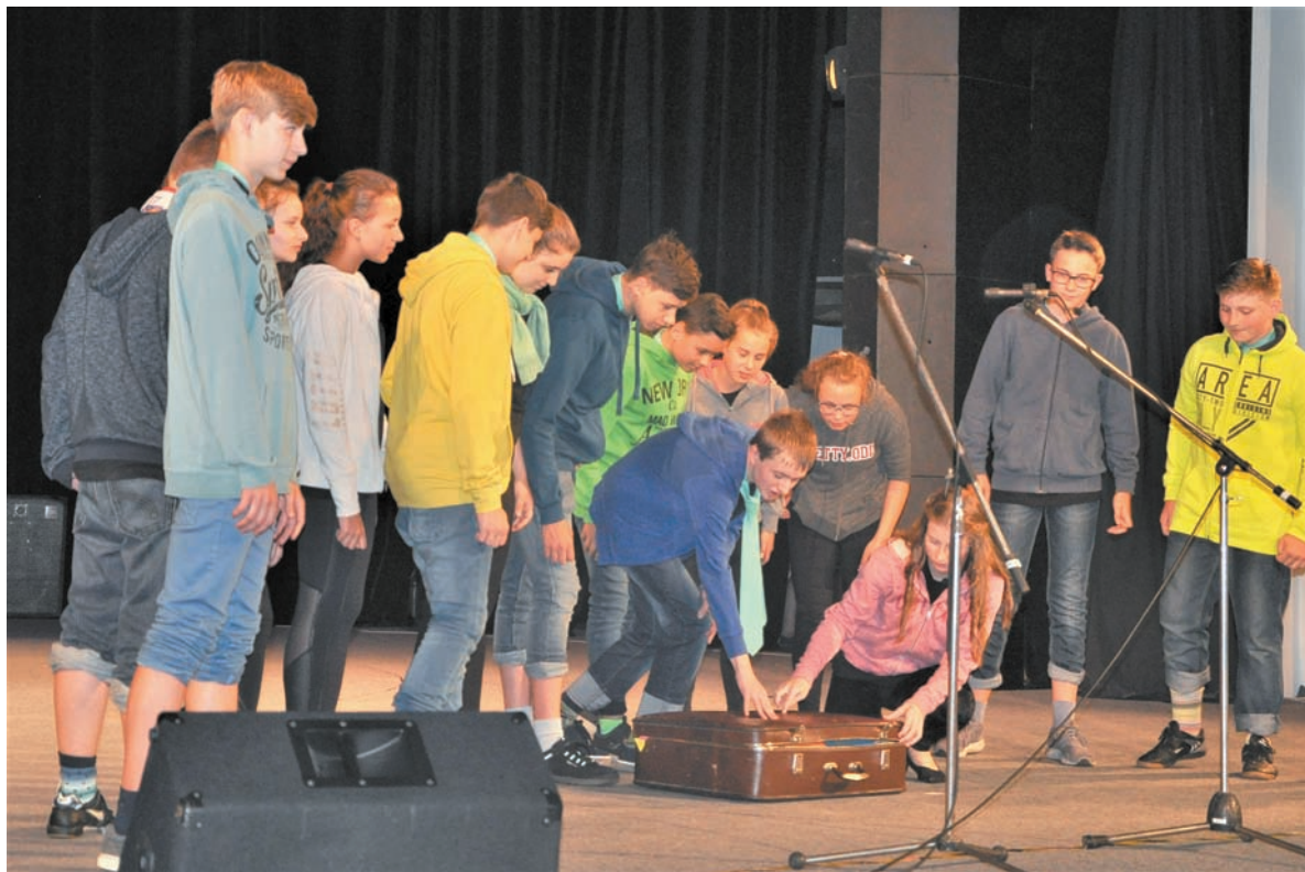
• Co jest w tej walizce? Zapomniane przez dzisiejszych nastolatków zabawki.

W drugiej części programu szkoła wystawiła przedstawienie „Uwierz w cuda – z książką się uda”, oparte na motywach klasycznych ba-