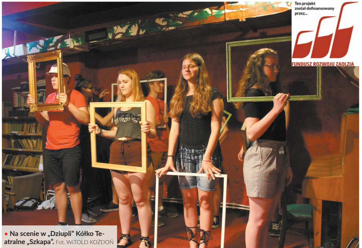
• Na scenie w „Dziupli” Kółko Teatralne „Szkapa”.

nał tegorocznych Dni Kultury Studenckiej, specjalne warsztaty zorganizowali w „Dziupli” przedstawiciele organizacji Demagog.