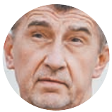
Andrej Babiš, premier RC w dymisji

Opodatkowanie restytucji kościelnych to nasz priorytet. Nie obawiamy się też ewentualnych rozpraw sądowych