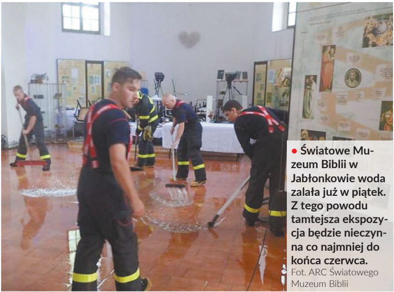
• Światowe Muzeum Biblii w Jabłonkowie woda zalała już w piątek. Z tego powodu tamtejsza ekspozycja będzie nieczynna co najmniej do końca czerwca.

Na lewym brzegu Olzy najtrudniejsza sytuacja panowała w Czeskim Cieszynie, gdzie w niedzielę pod wodą znalazło się ponad 20 obiektów, głównie domków jednorodzinnych. Gwałtowna ulewa zaatakowała w niedzielę około godziny 6.00. W ciągu czterech godzin na każdy metr kwadratowy terenu spadło w Czeskim Cieszynie ponad 90 mm wody. W mieście zebrał się sztab kryzysowy, a deszczówka zalała ulice Karwińską, Cmentarną i Rybacką. Na krótko ruchem pojazdów musiała kierować policja. W dolnej części ulicy Śląskiej poziom Grabinki wzrósł o ponad dwa metry. Strażacy musieli usuwać gałęzie oraz inne przedmioty utrudniające przepływ wody. Ich działania przyniosły jednak skutek i jej poziom zaczął spadać. Po południu w mieście było już dużo spokojniej.