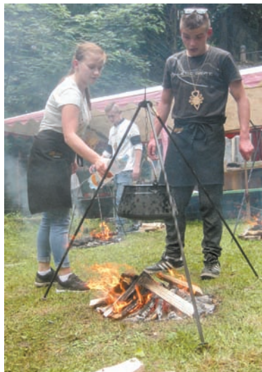
• Sobotnie gotowanie w „pięknych okolicznościach przyrody”.

Gomola chwali sobie „Kociołki”, na których jest już po raz ósmy, gdyż – jej zdaniem – pokazują młodzieży, jak ze zwykłych produktów można stworzyć niezwykle dania, ale przede wszystkim zachęcić do tradycyjnego, domowego gotowania w tej naszej fast-foodowej epoce.