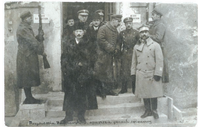
• Warszawa, 1919. Premier Ignacy Jan Paderewski (na pierwszym planie) przed gmachem Sejmu.

zapewnienie choćby nie najszybszego, lecz spokojnego i prawnego rozwoju.