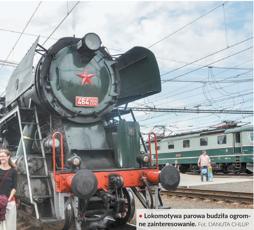
• Lokomotywa parowa budziła ogromne zainteresowanie.