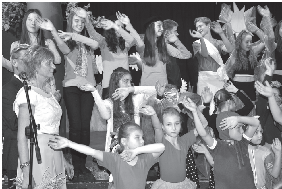
Na scenie Domu PZKO wystąpiła cała szkoła.