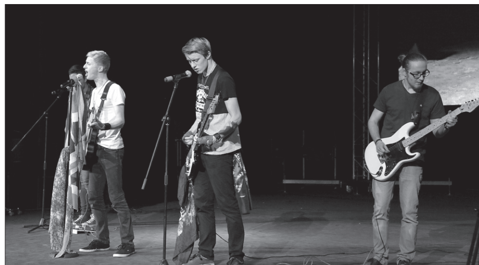
To idzie młodość, czyli Ampli Fire.