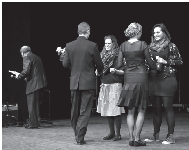
Organizatorki Festiwalu „Święto Herbaty”.