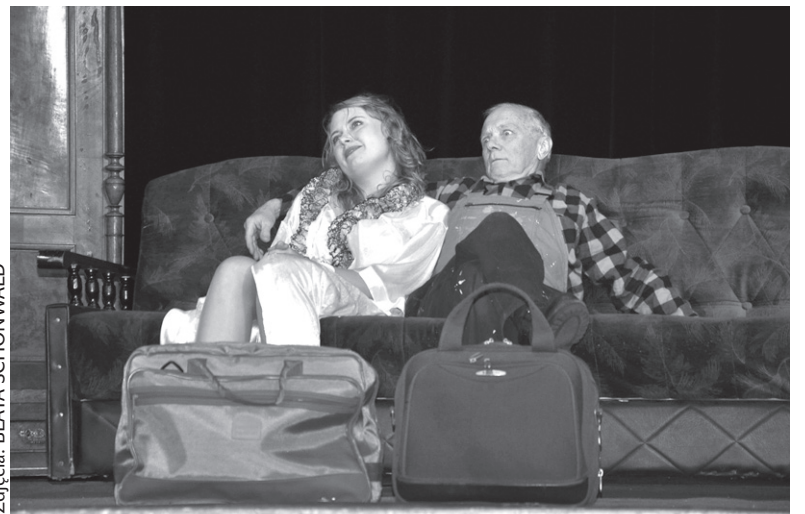
Chorzowski teatr ze swoją „Rajzyntaszóm”.