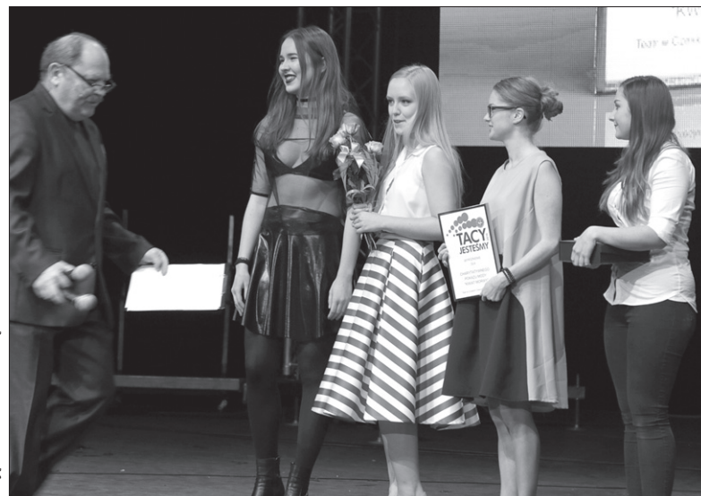
Organizatorki „Kwiatu Morwy”.