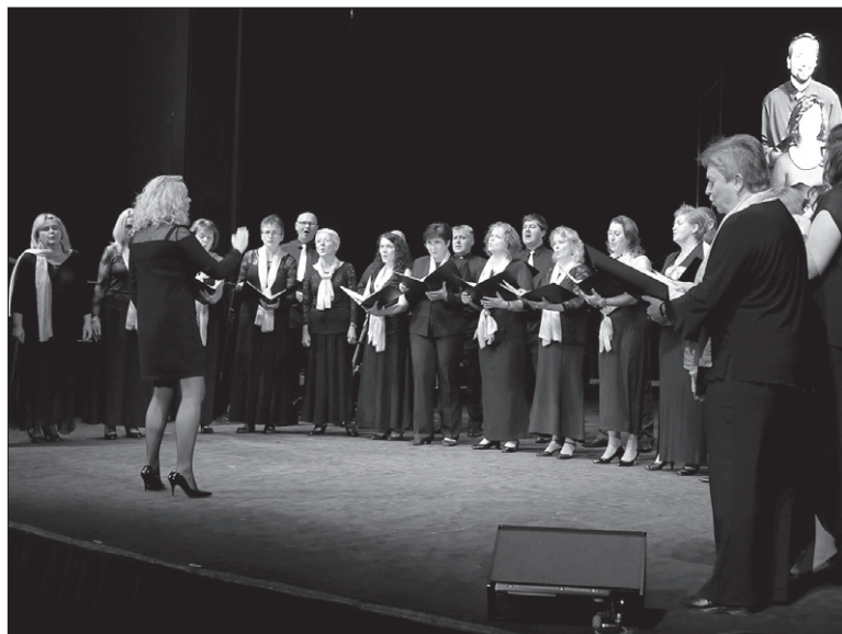
Polski Chór Mieszany „Collegium Canticorum”.