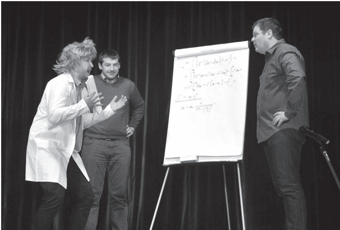
Nydeczanie zagrali krótki skecz o Einsteinie