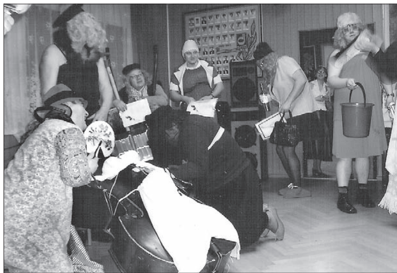
W rajskim Domu PZKO nad „przystrojoną” basetką w smutku pogrążona wdowa i zawodzące płaczki.

Członkowie rajskiego PZKO symboliczny pogrzeb tego instrumentu urządzą od lat. W tym ro-