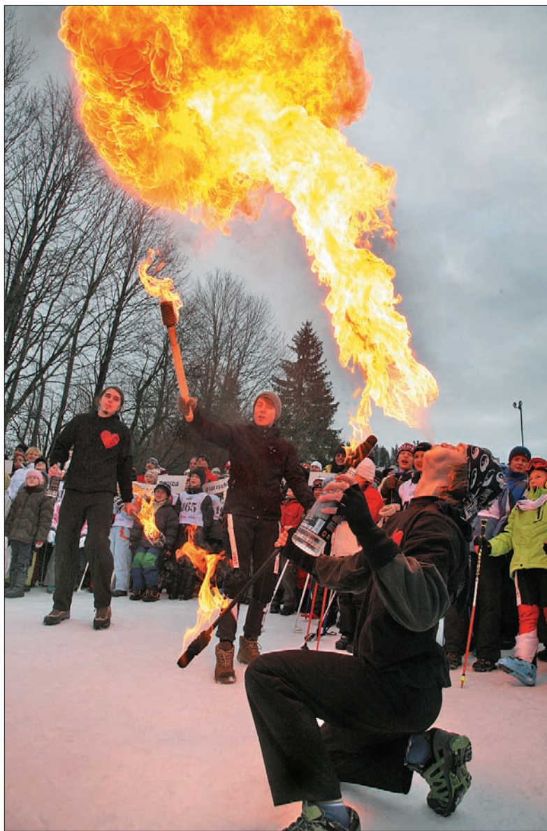
Ceremonia otwarcia Zjazdu Gwiazdzistego była bardzo widowiskowa. Na zdjęciu członek zespołu Night Fire.