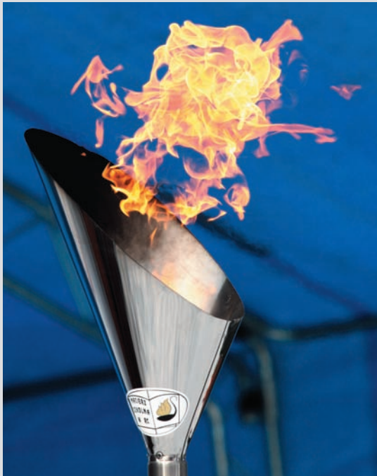
Płonie znicz igrzysk.

Zjazd Gwiazdzisty zwał w tym roku do Mostów koło Jabłonkowa 477 młodych zawodników z polskich podstawówek na Zaolziu. 174 narciarzy wystartowało w biegach, 303 w slalomie gigantycznym. Najwięcej złotych medali – osiem – wywalczyła po raz kolejny ekipa PSP im Henryka Sienkiewicza z Jabłonkowa. Barw „dolańskich” placówek najlepiej bronili narciarze z PSP Czeski Cieszyn, którzy w klasyfikacji ogólnej uplasowali się na czwartym miejscu. (jb)