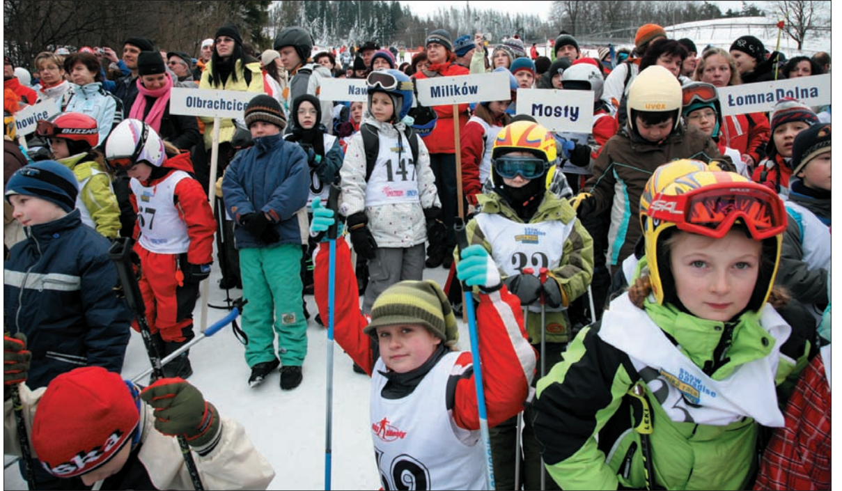
Chwila skupienia przed oficjalnym rozpoczęciem zawodów.