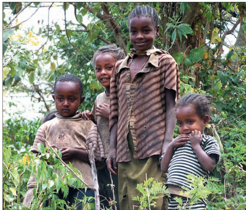
Dzieci chętnie pozowały do zdjęć, a białoskórzy goście byli dla nich nieladą atrakcją.

le głosu. Siostry starają się zdolne dziewczyny wysłać do szkół średnich w miastach. Misja opłaca ich wykształcenie, a one w zamian podpisują umowę, że po skończeniu nauki muszą wrócić i przynajmniej kil-