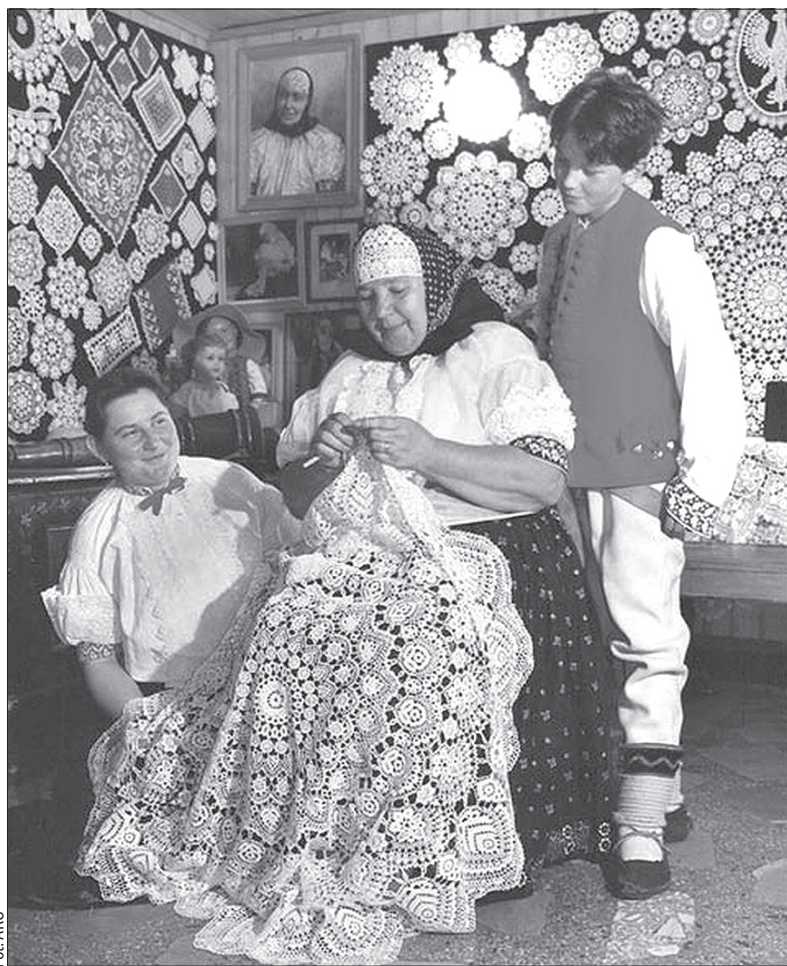
Heklowanie jest w Koniakowie bardzo popularne.

Chociaż historia koronki koniakowskiej zaczyna się pod koniec XIX wieku, największy rozkwit przypadł na lata po zakończeniu II wojny światowej. Koronczarki rozpoczęły współpracę ze spółdzielniami, które sprzedawały wyroby na cały świat. Asortyment jest bardzo bogaty – kołnierzyki, sukienki czy serwetki. Ostatni raz bardzo głośno zrobiło się o koronce, kiedy część kobiet zaczęła heklować stringi. Żeby się przekonać, jak dziś popular-